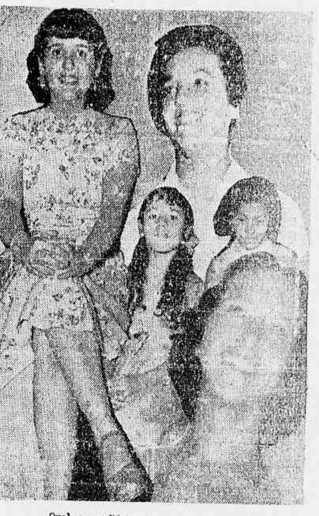
Qual a candidata de sua preferência?

NOTA — Se comprovadas as respostas chegadas até amanhã