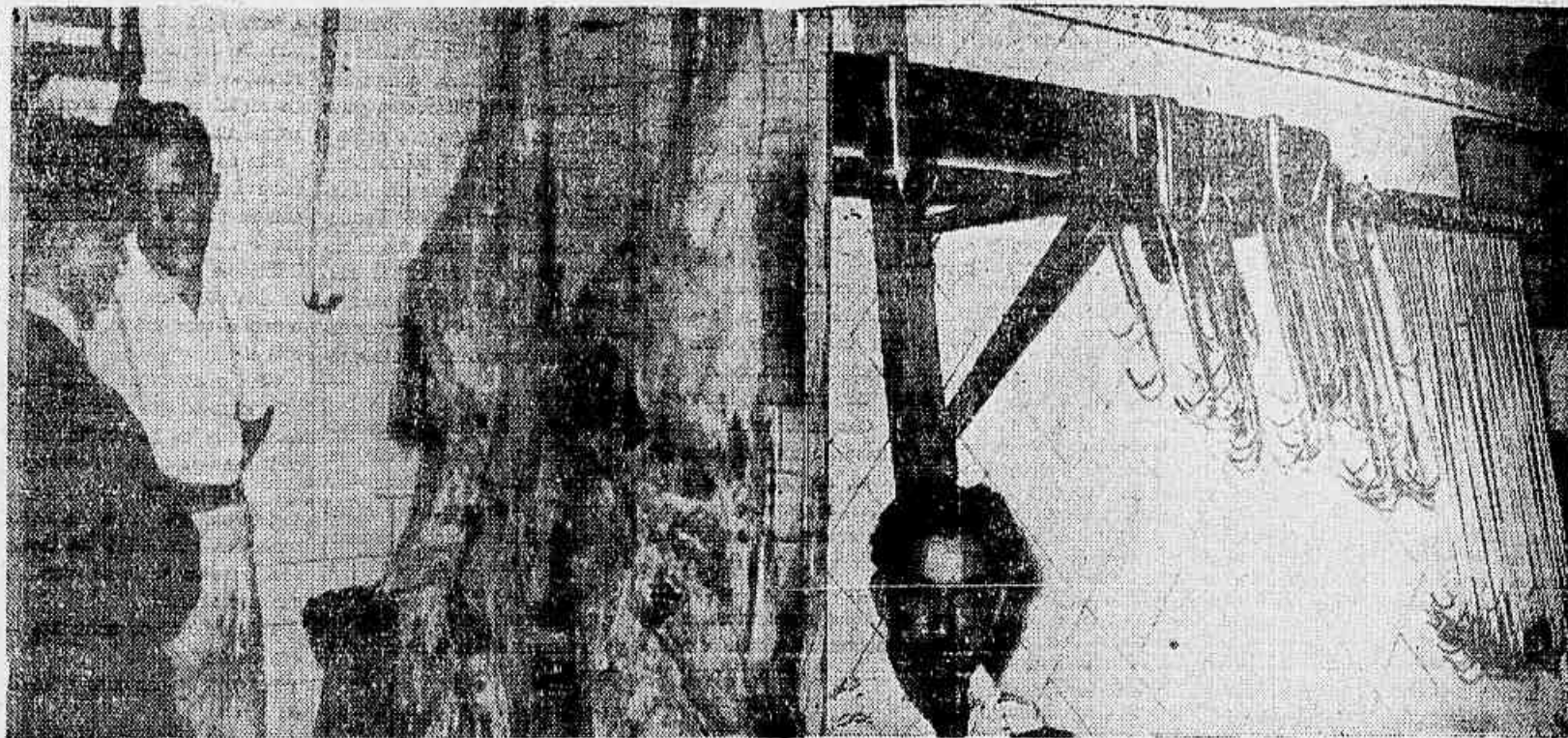
Muitas vezes não há carne. Quando há, é ruim e cara. Agora, apesar das promessas de Getúlio, ainda vai custar mais

Nenhuma promessa do sr. Getúlio Vargas foi tão difundida quanto a de entregar a carne verde ao consumidor carioca pelo preço de quinze cruzeiros. Tal medida seria consequência dos entendimentos hídricos, antes da posse, entre o novo presidente e os representantes dos frigoríficos.