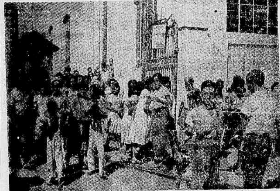
Flagrante colído no portão principal da Fábrica de Tecidos Mavilis Bonfim, quando os trabalhadores saíam para o almoço.

Trabalhadores nas Indústrias de Fiação e Tecelagem do Rio de Janeiro. A Comissão de Salários, criada para dirigir a luta, está desenvolvendo um grande trabalho de divulgação