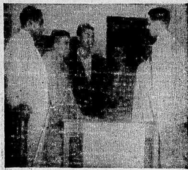
Os primeiros delegados do Ceará ao III Congresso falando à IMPRENSA POPULAR na sede do Movimento Brasileiro dos Partidários da Paz.