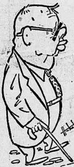
Gois Monteiro, general fascista, chegou hoje ao Rio de Janeiro. Não aceita tais conchaves. Não deixará que nenhum jovem brasileiro siga para ser massacrado na Coréia e saborear o seu repulso aos criminosos de guerra.

Ninguém melhor que Gois Monteiro para desempenhar a criminoso missão de que foi encarregado por Getúlio. O latifundiário de Alagoas, o general nazista condecorado por Hitler e Hiroito, o patrocinador da infâmia do plano Cohen e o articulador do golpe fascista de 37, sentiu-se à vontade para combinar com os banqueiros de Wall Street e os desesperados generais de Truman a manobra pelo qual o governo de Getúlio deveria enviar para a matança milha-