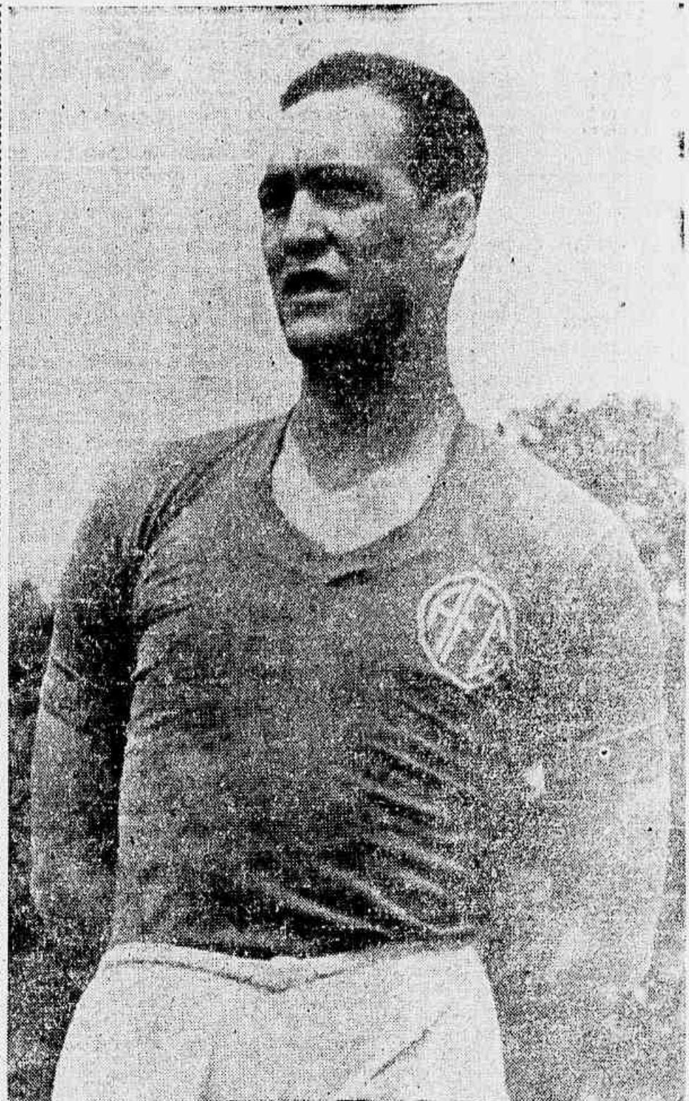
HELENO JOGOU BEM, MAS PECOU PELA INDISCIPLINA. AO QUE SOUBERMOS, UM GRUPO DE ASSOCIADOS RUBROS REQUERERÁ UM EXAME DE SANIDADE MENTAL PARA O CRAQUE

O Flamengo, saca à desistência do Botafogo de disputar o seu último jogo do campeonato que seria justamente contra o rubro-negro, sagrou-se campeão carioca feminino. O título das estrelas do «Mais querido», reveste-se de grande significação, por ter sido conquistado sem nenhuma derrota, isto é, invicto.