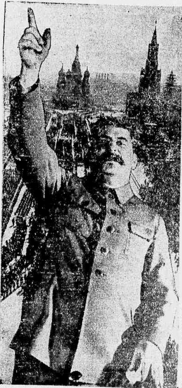
Stálin, campeão da Paz mundial, guia genial dos povos, que conduz a União Soviética vitoriosamente para o comunismo.