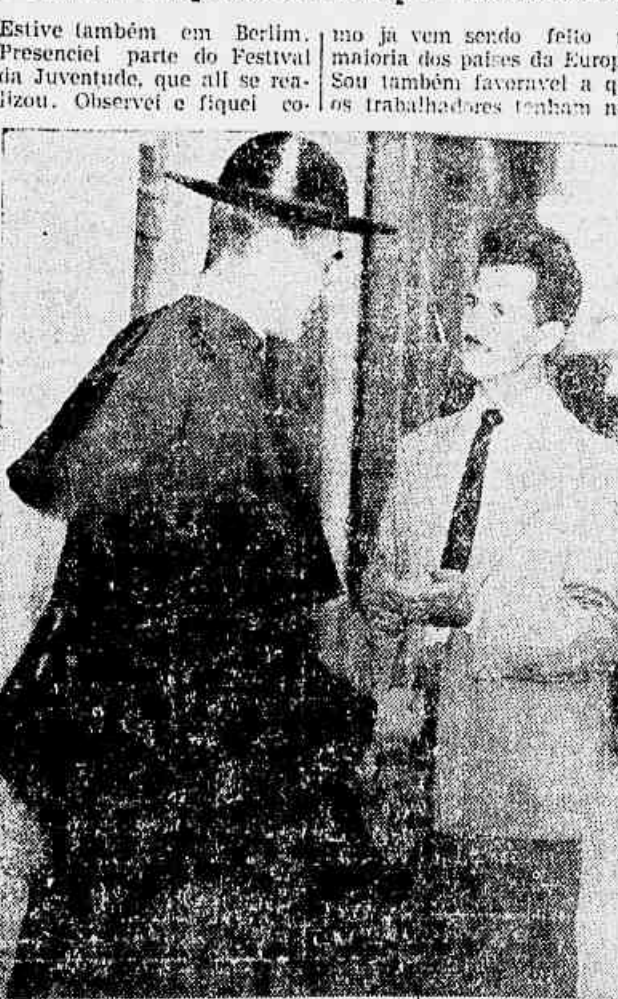
«A paz deve ser defendida acima de tudo» — afirma o reverendo à nossa reportagem —

Todos os partidos oposicionistas denunciam o peronismo — Foi a chefe da Fundação Eva Peron do Paraná quem deu o sinal para os bandidos começarem a atirar — O dirigente comunista se encontra em Rosário, e não pode ainda ser operado ★ Texto de 4.ª pág. ★