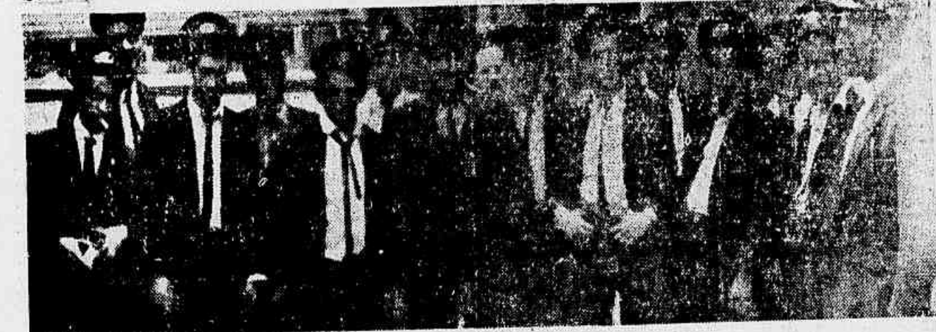
MOVIMENTAM-SE OS TRABALHADORES DA LIGHT