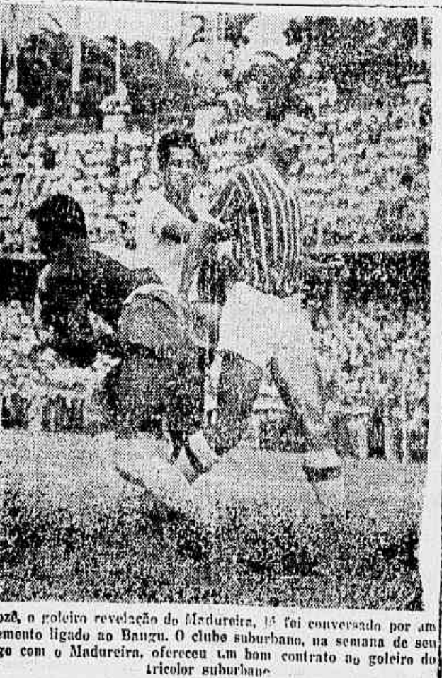
Prova a polêmica revelação da Madureira. Já foi conversado por um elemento ligado ao Bangu. O clube suburbano, na semana de seu jogo com o Madureira, ofereceu um bom contrato ao goleiro do tricolor suburbano.

Como ocorre tradicionalmente, o pareo mais apreciado é o da cyote a oito. Nestes últimos anos o Vasco tem ganhado fácil esta prova. Este ano deverá triunfar novamente. Mas, para tanto, terá de remar muito. O seu timoneiro que não será o veterano "Mocotó", atualmente responsável pelo preparo do oito do Flamengo, como assessor técnico da F. M. R., terá de andar muito certinho. Pois, um descuido, e a turma da Gavea entrará de rijo. Outras representações que não se devem desprestigiar serão as do Icarai e do Botafogo. A do primeiro clube em particular, cujos integrantes estão todos concentrados na ilha do Vianna, recebendo alimentação especial, desde 1 do corrente.