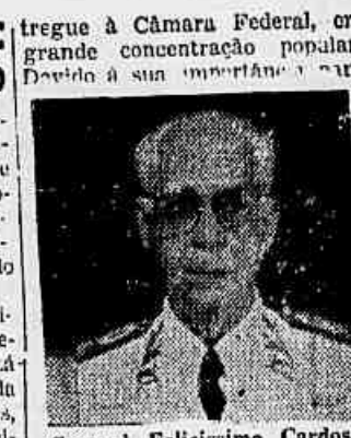
General Felicissimo Cardoso.

A propósito da campanha pela nacionalização da Light, iniciada pelo Centro de Estudos e Defesa do Petróleo e da Economia Nacional, procuramos ouvir o general Felicíssimo Cardoso, presidente em exercício do CEPEN, que nos declarou: — Tendo em vista essa medida de interesse nacional, foi redigido um manifesto que está recebendo a adesão de destacadas personalidades. Parlamentares, técnicos, industriais, engenheiros, entidades desta capital, líderes operários, estudantes e femininas, além de figuras de destaque em todos os setores da atividade estão emprestando o mais caloroso apoio ao documento. O manifesto será enviado. No próximo dia 29, às