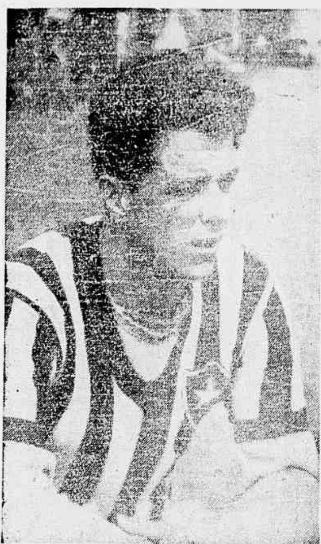
Arrieto, contundido seriamente num dos últimos jogos do turno, cedeu seu posto a Pirlito. E jogando da forma por que vem fazendo, o veterano centro-atacante está disposto a conservar o posto até o final do certame. Não dará desse modo a vez que o seu jovem colega espera com tanta ansiedade.