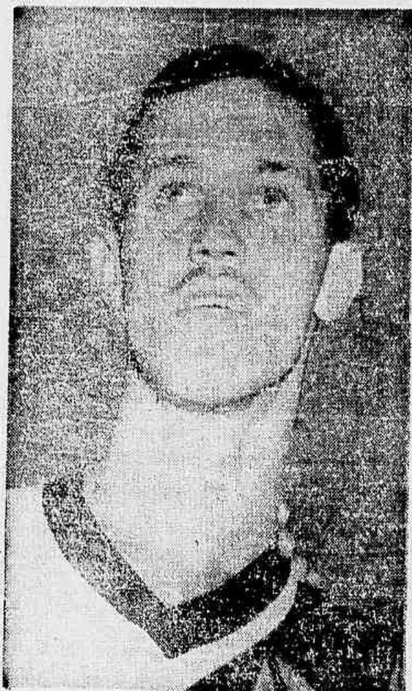
Ademar talvez faça uma canção.

Director: PEDRO MOTTA LIMA ANO IV - RIO DE JANEIRO, SABADO, 22 DE DEZEMBRO DE 1951 - N.º 918