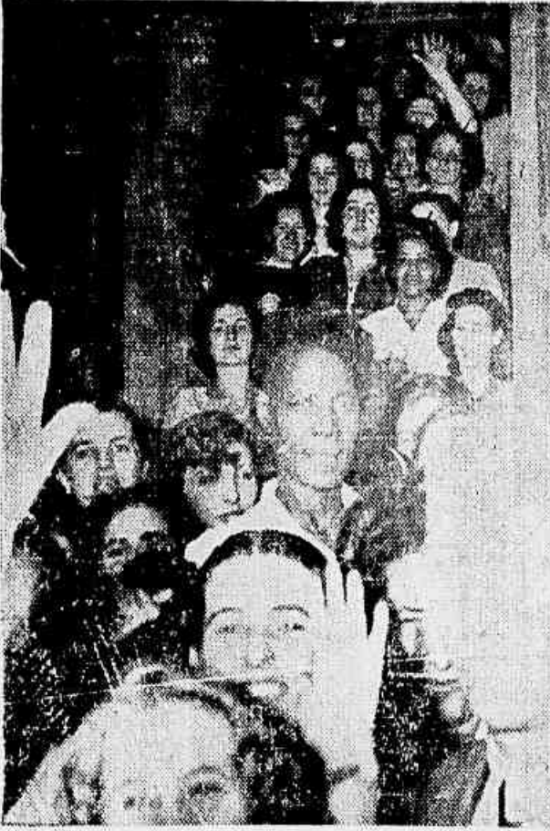
Flagrante colúbia à porta do Sindicato dos têxteis paulistas, quando, pouco depois das 7 horas da manhã, acorriam à sede do mesmo numerosos grupos de grevistas, constituindo a maioria de mulheres.

que o lucro acusado no último semestre deste ano, foi de mais de 600 milhões de dólares, o presente de Natal de Vargas à empresa imperialista significa um criminoso assalto à exausta economia do povo carioca e uma verdadeira afronta aos trabalhadores, que vêm lutando pela conquista de melhorias em seus salários e do Abono de Natal. Em face de mais esse descarado ato de proteção à Light, uma única resposta é cabível: para os trabalhadores, a intensificação de sua luta pela conquista dos aumentos nas bases que aprovaram, e do Abono de Natal como abono e não como empréstimo, e por parte do povo, protestos os mais energéticos contra a nova escorria.