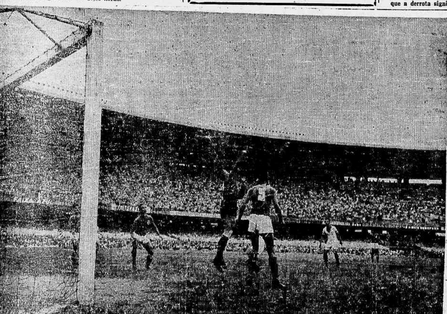
América e Fluminense no turno empataram, depois de um domínio quase absoluto dos rubros. Aliás, o tento dos tricolores foi assinalado no minuto final. Amanhã, os americanos terão a oportunidade de singrar na desce e, ao mesmo tempo, marcar para a reabilitação total de seus últimos insucessos.

Expediente das 9 às 11 e das 17 às 19 horas