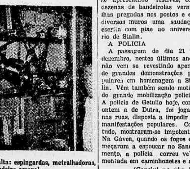
Em todas as lojas é o que não falta: espingardas, metralhadoras, canhões, um verdadeiro arsenal...

Há muitos poderia parecer impossível que o sr. Getúlio Vargas, neste fim de ano de todas as misérias, inclusive do racionamento de guerra de energia elétrica, pudesse ter a audácia de afrontar o povo com a autorização para o aumento das tarifas da Light. Mas, lançando-se contra a opinião pública e uma grande e poderosa corporação operária, explorada pela empresa, o governo «trabalhista» acaba de conceder os aumentos pleiteados: 10% nos serviços públicos de eletricidade, essa mesma que falta e determina, neste momento, o agravamento da miséria nos lares operários em consequência da redução das horas de trabalho na indústria, e prejuízos vultosos para o comércio, além dos inúmeros incomedidos à vida da população. Como se não bastasse, vem também, o aumento de 10 centavos por seção, nos serviços de bondes, transporte usado pela maioria da população trabalhadora.