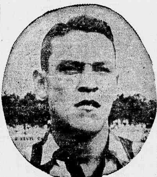
Otávio será marcado pelo notável Bulau, um dos esteios da defesa alva. Tanto alvos como alvi-negros estão confiantes num bom resultado amanhã. Para o Botafogo este prêmio será decisivo, de vez que a derrota significará a liquidação de suas esperanças.

VENDE-SE um terreno de 10x50 com um barraco situado à Rua SARGENTO AIRES PINTO - ANCHIETA Tratar à Rua Irene 21 - Tel.: 30-2828 - RAMOS - COM D. JOSEFINA SILVA