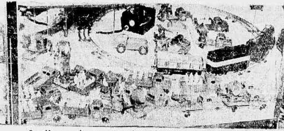
O emblema americano nos carros de assalto mostra a origem da propaganda.