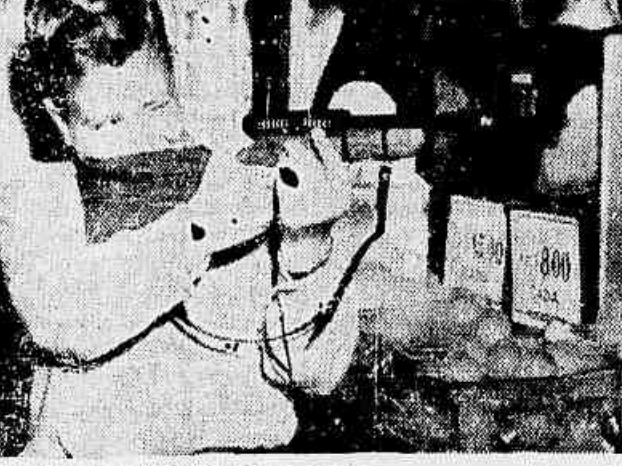
Assim como a mentalidade das crianças começa a ser deformada, o garoto faz pontaria para um alvo qualquer. Pegando a metralhadora dá vontade de atirar. O resto vem depois...

para os demais que apreciam a cena, manda embalar o brinquedo e sai se babando de gozo. Era o presente de natal que escolhera para seu filho. Mas umas duas ou três pessoas compraram também a espingarda, que custa 475 cruzeiros, conduzindo 12 balas de matéria plástica. As demais pessoas que alhavam a exibição não pareciam satisfeitas. Uma jovem senhora, com seu filho ao lado, chegou a pronunciar as seguintes palavras: «Que estupidez! Então não têm mais o que oferecer para as crianças? E um senhor, ouvindo o comentário, também acrescentou: «Eu soube que essas espingardas já deixaram diversas crianças cegas nos Estados Unidos». Leia na 4.ª página reportagem de atualidade sobre os brinquedos que se oferecem às crianças neste natal.