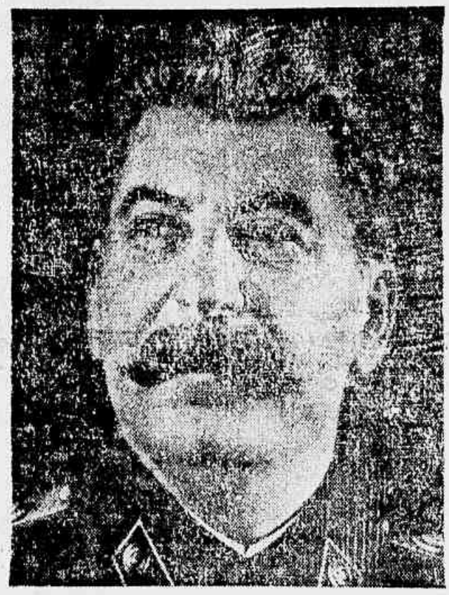
STALIN — Cujo aniversário os povos do mundo comemoram ontem com carinho e admiração.

Participando das comemorações ontem verificadas em todo o mundo, em homenagem ao 72º aniversário do generalíssimo Stalin, o povo carioca realizou, também, na passagem de mais um 21 de dezembro, diversas manifestações de carinho ao guia genial da luta pela paz e pela libertação dos povos.