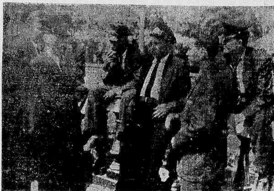
Motoneiros e condutores da 4.ª Seção, falam à nossa reportagem em frente à Estação Barão de Mauá.

Falou, em seguida um motoneiro: — Com os 40 por cento que sobram o aumento não será superior a 25 por cento, ou ainda muito menos. De-