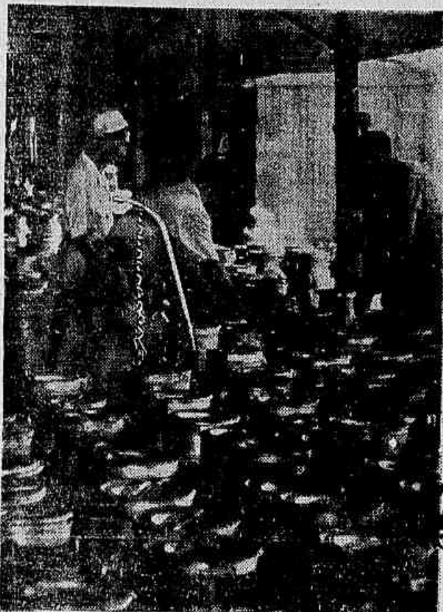
Antigamente era assim. Muitos latões chegavam e ainda era pouco para atender a toda a cidade e mesmo batendo a média do leite consumido por pessoa não passava de uma chicara. Agora, nem isso; os latões não chegam mais ao Entrepósito da Cooperativa. Os tubarões estão em 'lock-out'.