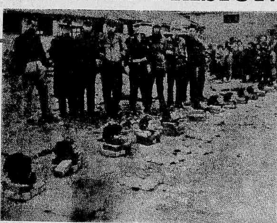
Esta fotografia constitui documento da maior importância contra os agressores ianques na Coreia: uma fileira de cabeças decepadas exposta nas ruas de uma aldeia ocupada pelas tropas nortio-americanas. Tal como os soldados de Hitler, os homens de Truman atiram-se ferozmente contra a população civil que se recusa a aceitar suas imposições e organizam massacres punitivos. Agora, a rádio de Piongyang denuncia outro crime monstruoso — fuzilamento sumário de prisioneiros de guerra num campo de concentração.