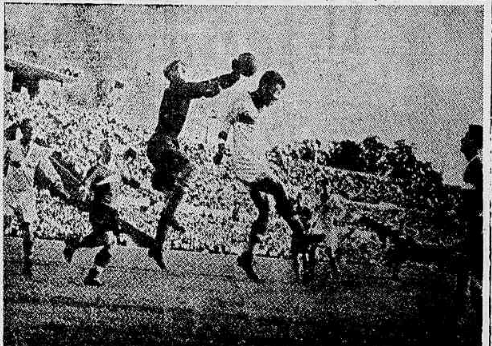
Uma defesa do goleiro do Spartak, no estádio do Dinamo.

vinde partidas brilhantemente ganhas. O mais importante como resultado desses encontros é que a «artilharia» espartakista conseguiu encaixar nas redes adversárias 116 tentos contra apenas 15. Um salto