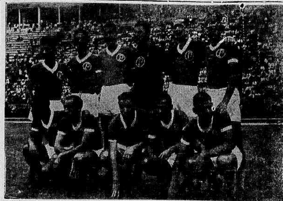
Em caso de vitória do Corinthians, o Palmeiras jogará com o São Paulo apenas para constar, pois nada mais poderá pleitear. O clube do Par que Antartica, cuja equipe vemos acima, terá interrompido, desse modo, a sua série de triunfos iniciada com a conquista do campeonato de 50 culminando com a conquista da Taça Rio.

O concurso de poemas terminará no dia 27 de Janeiro. O resultado será anunciado na Noite de Arte, que se realizará na Associação Brasileira de Imprensa, no dia 29 de janeiro, cabendo ao vencedor o prêmio de Cr$ 500,00.