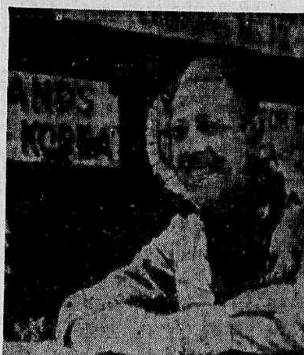
Eis o tratamento dado aos prisioneiros de guerra norte-americanos e ingleses na Coreia: a gravura mostra um deles, jogando xadrez, num campo-prisão situado no norte do país.

Chu En Lai passou em revista os acontecimentos mundiais nestes dois anos, destacando o auxílio fraterno da URSS ao trabalho construtivo da República Popular da China.