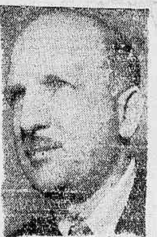
Regressou o Deputado Roberto Morena

Essa nova demonstração do ódio de classe de uma justiça a serviço dos exploradores do povo só é possível devido ao clima de perseguições aos trabalhadores sob o governo de Getúlio. A classe operária e a todo o povo cumpre mobilizar-se para anular essa sentença fascista.