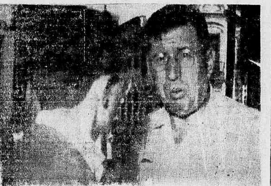
Na porta de seu estabelecimento, o proprietário da padaria manifesta-se contrário à autoridade de fabrico do pão de guerra.

rentes dessa perturbação. Pelas palavras do facultativo, pode-se calcular a extensão do perigo à que está