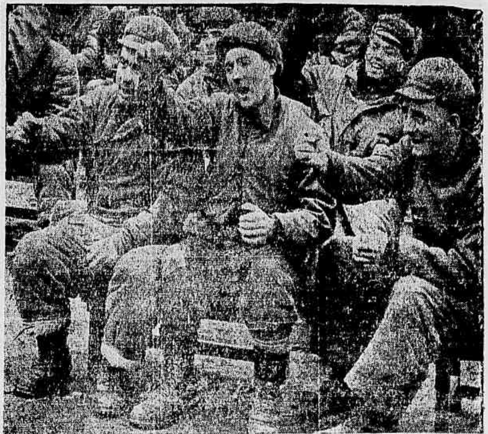
A fotografia acima foi enviada pelo correspondente Allan Wilmington, do «Daily Workers», ao seu jornal em Londres. Ela mostra um grupo de prisioneiros britânicos na Coreia, em animada torcida, enquanto seus companheiros disputam uma partida de futebol. Os prisioneiros representam peças teatrais, praticam diversos esportes, leem e estudam — e todos eles, embora bem tratados, estão marginalmente arrependidos de se haverem deixado levar à infame agressão imperialista contra o heróico povo coreano.