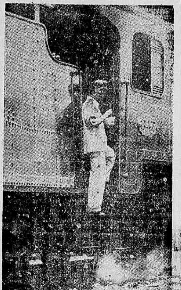
Este maquinista, aproveitando a breve parada para limpar a máquina, alimenta-se com o arroz e o feijão que trouxe de casa pela madrugada. Os trabalhadores da Leopoldina não têm hora de descanso para almoçar, e isto é um flagrante desrespeito às leis trabalhistas.

Não denunciaram os ferroviários somente as irregularidades praticadas pela empresa e que os afetam diretamente — a sabotagem ao patrimônio da empresa, que vem sendo levada a prática pela atual direção, e que coloca em perigo a vida dos passageiros. Existe grande número de locomotivas que trafegam sem nenhuma segurança dado o péssimo estado em que se encontram. Entre essas foram citadas as locomotivas 361, 366, 363, 360, 370, 363 e 354. A locomotiva 359 há dias atrás empenhou em disparada a barra de conjugação separando-se dos carros que puxava. Somente por milagre não houve um desastre de graves consequências. Segundo fomos informados quase diariamente são dirigidos reclamações a direção da Leopoldina sem que esta, contudo, tome as mínimas providências. Atualmente os trabalhadores estão preparando um novo memorial denunciando as péssimas condições das máquinas e uma relação das que se apresentam em pior estado para exigir seu conserto.