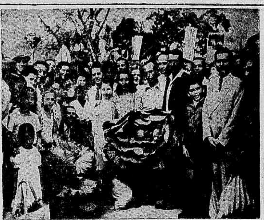
No 30.º aniversário do PCB

Campanhas como a da participação do Brasil na guerra contra o eixo nazi-fascista e a anistia, destacaram o Partido Comunista do Brasil como o único realmente querido pelas grandes massas populares. O amor e o carinho do povo brasileiro ao seu Partido e ao seu grande chefe, Luiz Carlos Prestes, nos anos da legalidade, afirmaram-se como um fato incontestável. De norte a sul do país, a presença de Prestes mobilizou dezenas e centenas de milhares de homens e mulheres, jovens e velhos, em gigantescas demonstrações de massas. A foto histórica que hoje apresentamos é um flagrante dessas demonstrações, esta, no bairro de Jacarepaguá, vendo-se o Cavaleiro da Esperança e sua filha, Anita Leopoldina, entre os moradores do bairro.