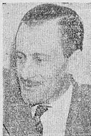
Senador Alberto Pasqualini

Em entrevista concedida à Agência Inter Press, o senador Alberto Pasqualini fez importantes declarações de apoio à participação do Brasil na Conferência Econômica Internacional que se realizará em abril na capital soviética.