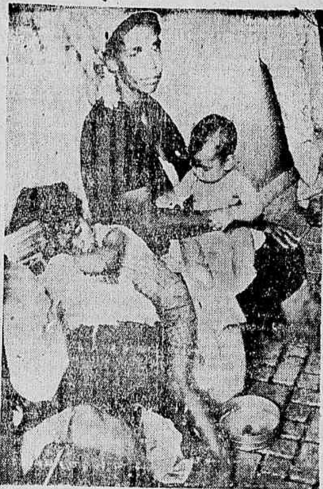
CRISTIANAS brasileiras, sub-nutridas e doentes, erram pelas ruas com seus pais à procura de comida

Só existe um caminho para resolver a fome do povo. Este é o caminho da política de paz, isto é, do desenvolvimento das relações comerciais com todos os países, dentro do princípio da coexistência pacífica entre as nações, a redução de taxas e impostos (diretos e indiretos) que fariam baixar os preços de todos os artigos e gêneros, a transformação da indústria de guerra — que está sendo equipada principalmente em São Paulo — indústria esta onerosa, que representa uma verdadeira carga para a nação, em indústria civil, e a estabilização dos salários ao nível do custo da vida. Ter-se-ia, assim, um equilíbrio que indubitavelmente aumentaria a capacidade aquisitiva do povo.