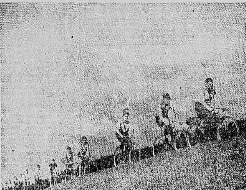
Aspecto de uma competição ciclistica na União Soviética

os Estados Unidos, Suécia, França, Holanda, Noruega, Dinamarca e Itália, países que sempre estiveram à frente na conquista de títulos mundiais. Nos 100 metros rasos a URSS conserva lugar no mundo com a atleta Malschina, na marca de 18" 40. Nos 200 metros 4