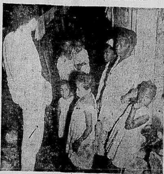
Moradores da Favela Niemeyer quando falavam a reportagem

NOVAS VÍTIMAS EM SÃO PAULO — TAMBÉM O PARANÁ ATINGIDO PELA EPIDEMIA (Correspondências na 2ª pág.)