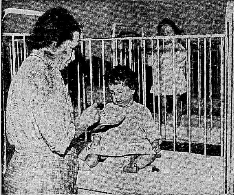
A VIDA das crianças está em perigo com a ameaça da guerra. É preciso salvá-las o mais possível com a luta de todos os povos, protestando contra a guerra que os americanos já executam na Coreia e em outras partes do mundo, exigindo que as cinco grandes potências firmem um Pacto de Paz que garanta a tranquilidade e a segurança dos povos