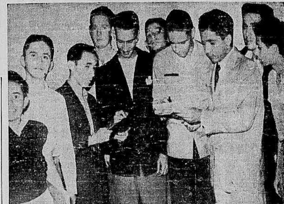
JOVENS partidários da Paz do Distrito Federal assinam o Apelo por um Pacto de Paz. Os jovens contribuíram para a campanha de coleta com um milhão de firmas em todo o Brasil