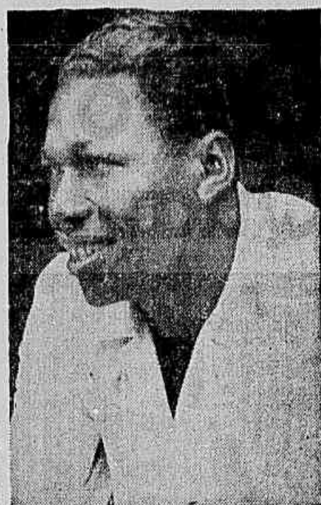
AVILA, centro-médio botafoguense

O esporte na URSS e nas Democracias Populares