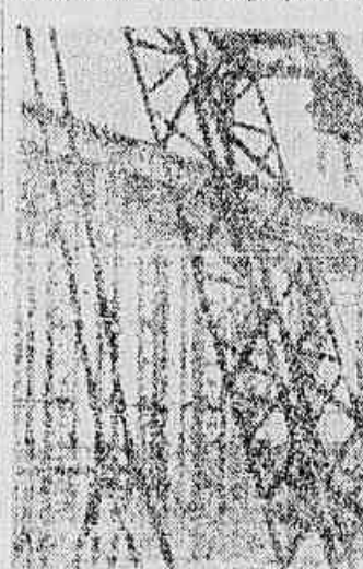
Alimentar as grandiosas obras de Paz e de progresso e do trabalho a que se dedicam os operários da fábrica Rostselmach.