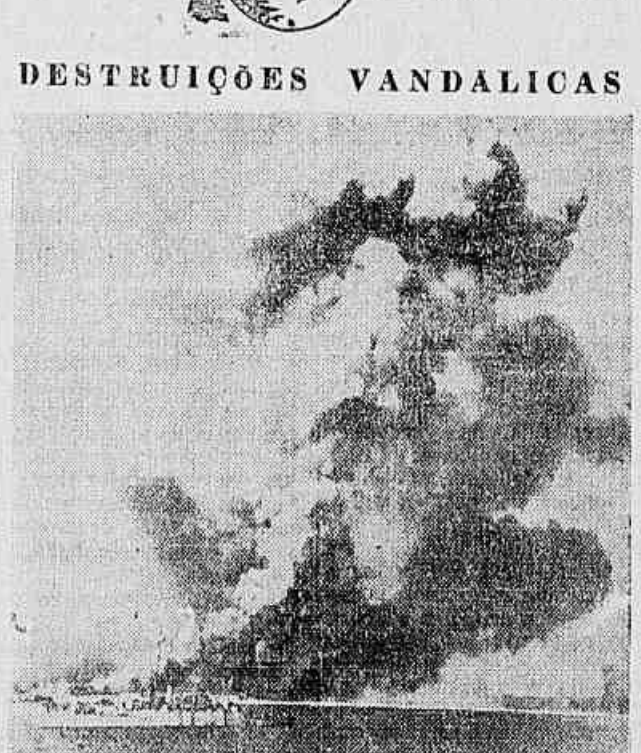
A foto acima dá bem uma idéia da fúria incendiária dos bárbaros americanos, que puseram em prática na Coreia a fúria da sterra arrasada. Cidades inteiras, que a população pacífica construiu durante anos, com inauditos sacrifícios, são pulverizadas em minutos sob o impacto de toneladas de bombas napalm, de gasolina gelatinosa, ou outros engenhos igualmente terríveis. Podemos permitir que isso continue?