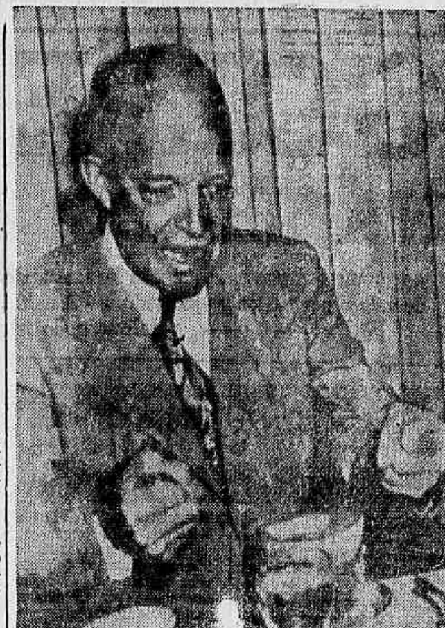
Eisenhower em palpos de aranha

NAÇÕES UNIDAS, Nova Iorque, 1 (AFP) — O grupo árabe-asiático na Assembleia decidiu solicitar à Comissão Política da Assembleia uma audiência do Bey de Tânis, ou de um representante designado por este por ocasião do debate sobre a Tunísia.