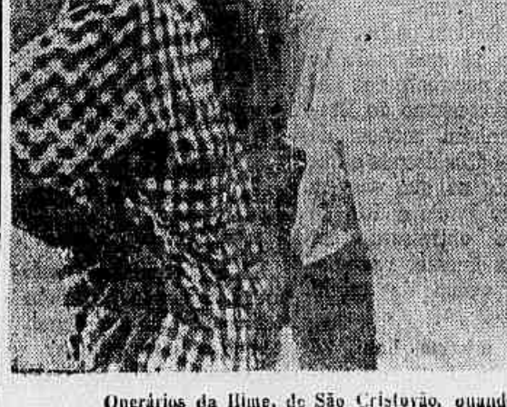
Operários da Ilme, de São Cristóvão, quando falavam a reportagem