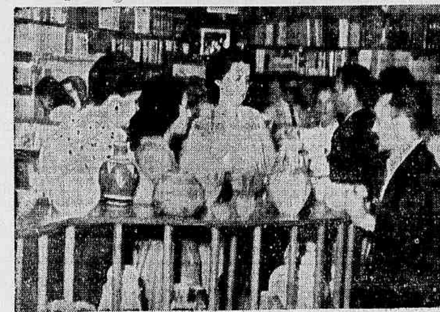
Ontem à tarde, na Livraria Independência, foi inaugurada uma exposição de pintura e cerâmica na qual estiveram representados conhecidos artistas, como Clovis Graciano, Ibero Camargo, Rebelo Gonçalves, Quirino Campofiorito, Inimá de Paula, Israel Pedrosa, Jordão de Oliveira, Chlau Deyvea, Sigaud, Iore Morales. A exposição está aberta ao público. E' do ato inaugural o flagrante acima