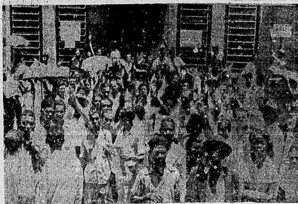
Confiantes em suas forças, os grevistas concentram-se no Sindicato, superlotando todas as dependências