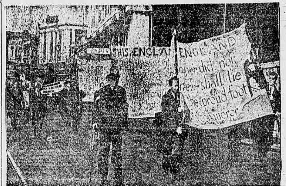
CENTENAS DE POPULARES aplaudem nas ruas de Liverpool, na Grã Bretanha, essa demonstração contra a presença das tropas norte-americanas, que — segundo o Acordo assinado pelo governo — gozam de poderes extraordinários no país. A segunda faixa carregada pelos manifestantes é uma oportuna citação de Shakespeare: «Esta Inglaterra, que não quer conquistar os outros, fez de si mesmo vergonhosa conquista».