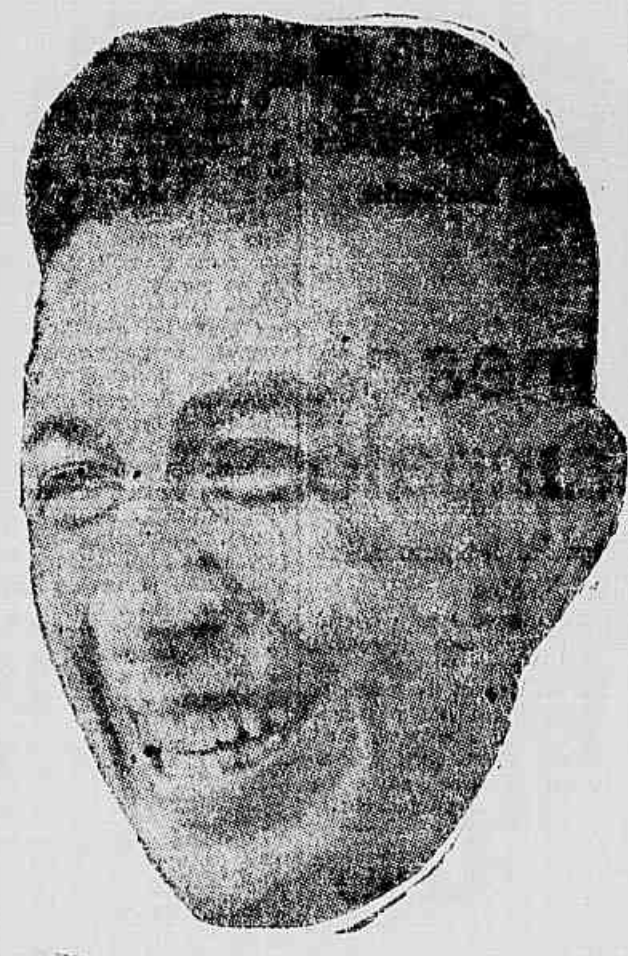
PARAGUAIO, o «artilheiro» da segunda vitória alvi-negra

formou à nossa reportagem que somente algumas horas antes da partida escalará o quadro que dará combate ao time brasileiro.