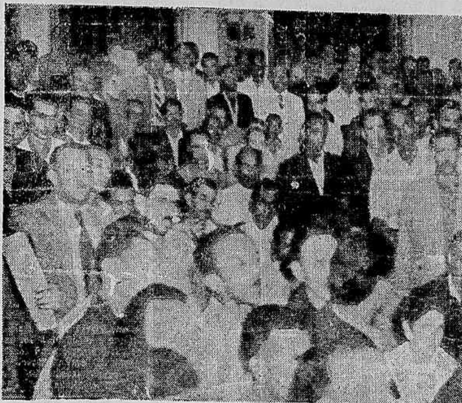
Flagrante da concorrida assembléia dos metalúrgicos ontem à noite

DIRETOR: PEDRO MOTTA LIMA IMPRENSA POPULAR ANO VI — Rio, Sábado, 31 de Outubro de 1955 — N. 1643