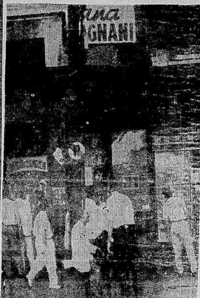
MESMO LUCRANDO MILHÕES com a programação dos "abacaxis" americanos, os tubarões do cinema querem trinta por cento de aumento nas entradas (Leia reportagem na oitava página)