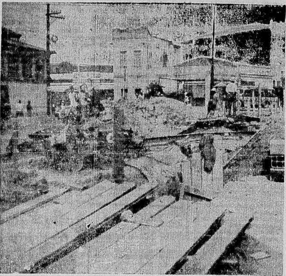
Éis um aspecto do estado em que se encontra a rua São Luiz Gonzaga, em São Cristóvão. O boteiro ali aberto pela Prefeitura dificulta ainda mais o péssimo transporte de que dispõe os moradores da localidade, além de enfiar o bairro...

tados que formam uma população de 85 mil pessoas, enviaram um extenso memorial ao prefeito, contendo centenas de assinaturas, apontando todas essas ir-