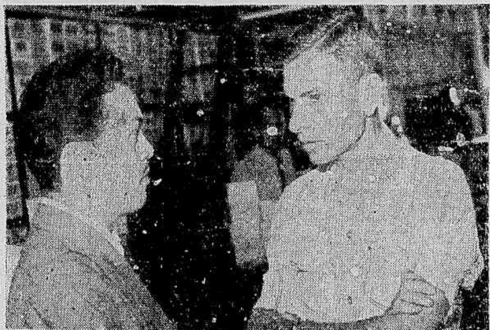
"Assegurar a independência econômica do Brasil é uma das incumbências mais patrióticas que pode haver", declara a nossa reportagem um dos socios da Fábrica Zenith