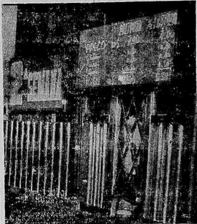
De Cr$ 7,90 os ingressos passaram para Cr$ 10,30. Agora de novo exigem os exibidores um novo aumento

Ribeiro, presidente da Confederação Nacional das Indústrias, disse que recusa que as consequências do Plano Aranha caíam sobre as estruturas das empresas industriais. No caso específico da Indústria de Higiene e Artigos de Tocador, o presidente do respectivo Sindicato, sr. João Corujo, mobilizou os industriais desse ramo que numa reunião resolveram enviar um memorial ao sr. Osvaldo Aranha, defendendo a própria sobrevivência de suas fábricas.