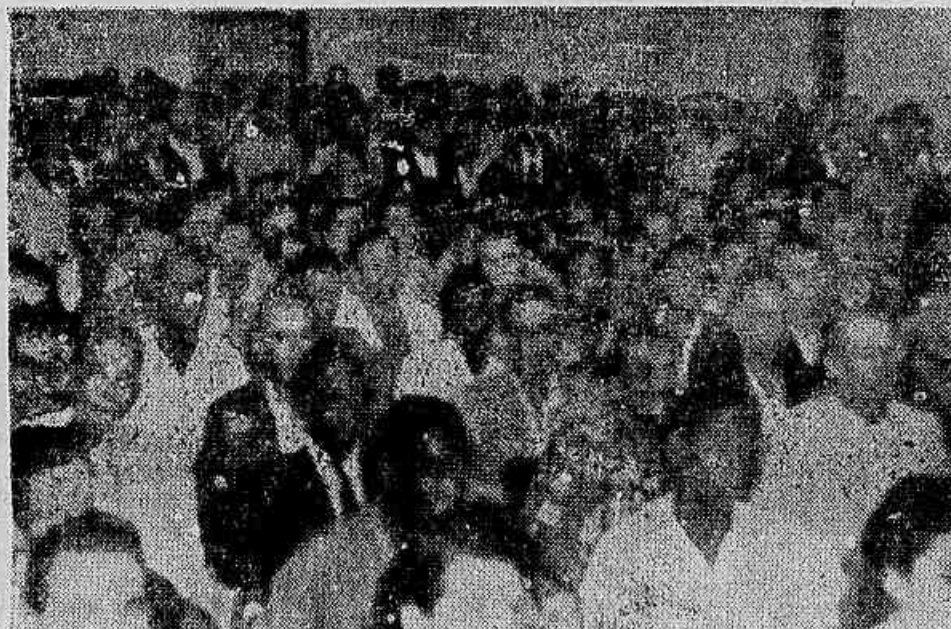
CENTENAS DE TRABALHADORES em bebidas reuniram-se ontem em grande assembléia em seu Sindicato, deliberando entre outras coisas exigir a extinção imediata da Guarda Particular da Cia. Antártica. Na quinta página damos reportagem sobre esta assembléia, da qual vem um flagrante no oitavo acima

Reafirmou-se também na assembléia que só será procedida a volta ao trabalho com o atendimento do programa de cinco pontos: Para reforçar sua organização os mineiros resolveram ainda na assembléia