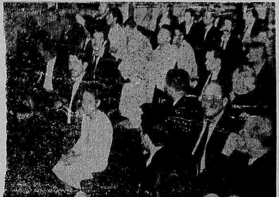
«Trabalhadores da Light, empregados nas linhas da Cia. Ferro Carril Carioca, foram no prazo até o dia 28, para o pagamento dos atrasados que o truste imperialista lhes deve. Naquela data, caso nada tenha sido solucionado, os trabalhadores em carra vollarão e se reunir para deliberar a atitude a tomar. No clichê, um flagrante da assembleia de grãnd-feira última, quando foi marcado o prazo à Light