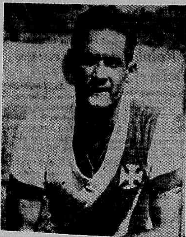
Maneco. Um nome para a ponta direita

Ferrari teve destacada atuação na posição de centro-médio, jogando pela equipe colombiana da América.