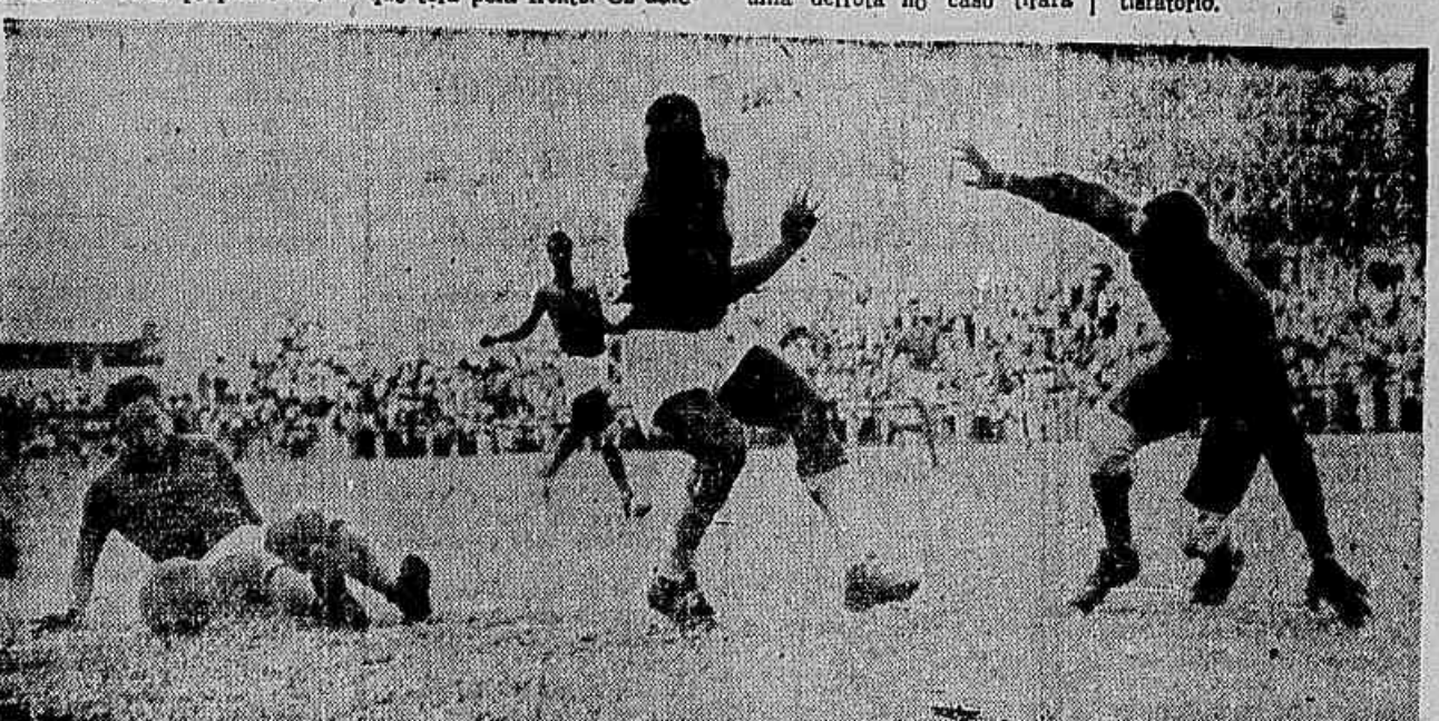
Leonidas. Agora foi lembrado para extrema direita

todas as esperanças a uma colocação honrosa. O ambiente nos setores de Campos Sales é o melhor. A turma do América está esperançosa de um resultado satisfatório.