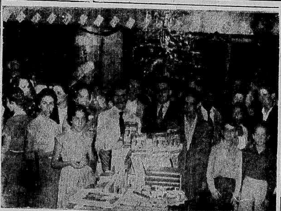
"UM HOMEM DE VERDADE" — Por motivo do lançamento, em português, do grande livro de Boris Polevoi, a Livraria Independência ofereceu, ontem, um coquetel aos seus clientes e demais pessoas que compareceram ao ato, promovendo, ainda, o sorteio de uma boneca e um mecânico entre as crianças que se viam presentes. (Fixa o clichê um aspecto da reunião.)