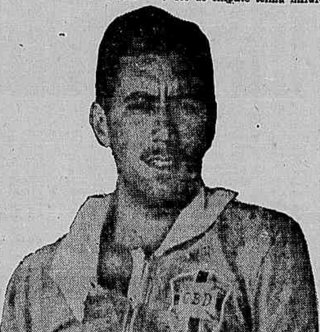
Santos. Com todas as glórias de «scratchman» não escapou a uma injustiça por parte de um diretor do Botafogo

A contagem final do torneio é a seguinte: 1) Flamengo, Santa Fé e Olimpia, com 12 pontos; 2) Palestino e Paisandú, 6; 3) Billa, 4; 4) Antofagasta e Universitaria de Quito, 2; 5) Palestino, 0.