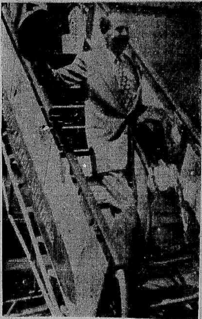
Zatopek, ao saltar do avião da KLM, na tarde de ontem a esta capital