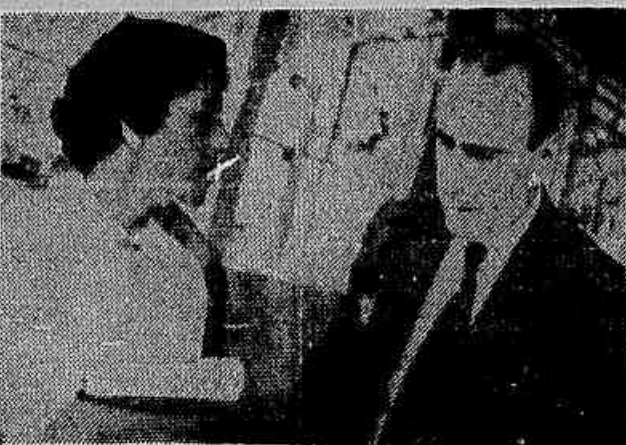
"Encontrei um mundo de paz, progresso, alegria e bem-estar", declara-nos o deputado Baltazar Castro

Passou por esta capital, de regresso da URSS, o deputado Baltazar Castro — Conferenciar 40 minutos com Molotov — Fala à IMPRENSA POPULAR o ilustre parlamentar chileno