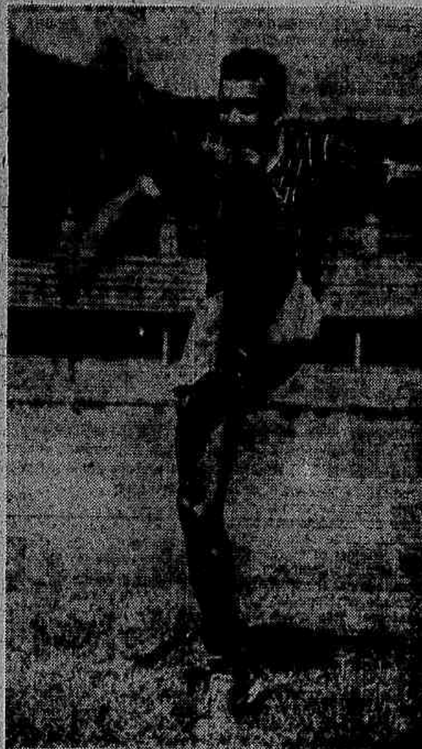
Paraguai cotado para voltar ao quadro titular do Fluminense

Atuou como juiz Mr. Harteles. A renda foi de Cr$ 477.444,00.