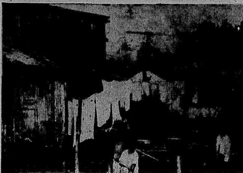
Com o salário mínimo de Vargas os trabalhadores só podem morar em barracos como este. Com os 2.400 cruzeiros reivindicados a situação em matéria de moradia, pouco poderá melhorar.

Comissão, dia 8 deste mês, foi apresentado o trabalho elaborado pelo SEPT (Serviço de Estatística da Previdência e Trabalho). Nele se continua a recomendação de aumentar o nível para Cr$ 2.128,00 na Capital da República. Isso, com base em pesquisas e estudos de dados estatísticos nos quais não foi possível esconder a negra realidade de uma situação de penúria extrema para as camadas assalariadas, contrastando com uma situação de prosperidade para os grandes industriais e comerciantes. O volume tratado consignava para o primeiro trimestre deste ano um aumento, apenas, de 16% no custo da vida, quando é notório que o