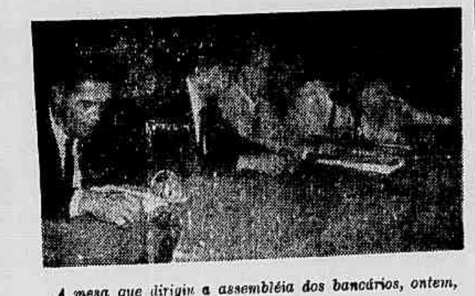
A mesa que dirigiu a assembleia dos bancários, ontem.

ao Ministério do Trabalho, quando solicitará a oficialização de sua investitura. Jango Goulart, presente ao Teatro João Caetano antes do ocorrido, afirmou que respeitaria qualquer que fosse a decisão da assembleia. Eleger a Junta, foi esta a decisão. Dentro de alguns dias a Junta Governativa eleita por milhares de bancários convocará uma assembleia para que a corporação decla-