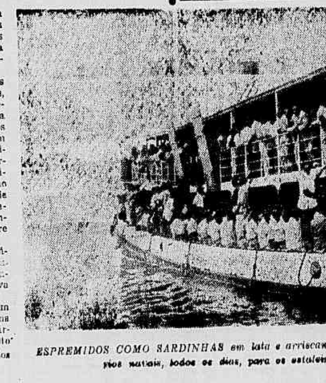
ESPREMIDOS COMO SARDINHAS em lata e arriscando a vida, assim viajam os operários marítimos, todos os dias, para os estaleiros da ilha Mocangê

um direito assegurado pela Constituição. Isso aconteceu a 16 de outubro, quando os operários foram cercados na ilha por fuzileiros navais armados de metralhadoras. As demais reivindicações apresentadas pelos operários, como por exemplo, a de melhor condução, pois vinjam na "Lancha Lóide 17" espremidos como sardinha em lata e sem salvação, respondeu o ministro que são assuntos internos da administração do Lóide. Nesse ponto, assim como no caso da reivindicação de reunião nos locais de trabalho, o sr. Jango procurou lançar a responsabilidade sobre a direção da empresa. A reivindicação dos operários sobre pagamento da taxa de insalubridade, respondeu o ministro que estava estudando. O sr. João Goulart também não respondeu coisa alguma sobre o cumprimento, por parte do Lóide, do acordo feito em consequência da greve dos marítimos.