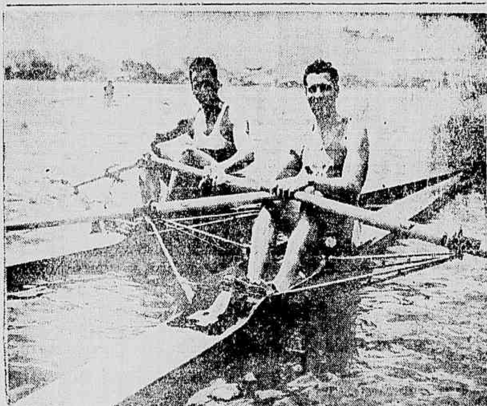
Uma fase da regata de domingo