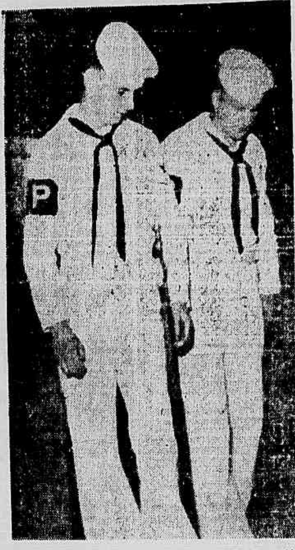
OS GRINGOS FARDADOS estão à solta, perturbando a vida da cidade com suas atitudes e seus modos cafajestes. Al estão dois de cabeça baixa, apavorados diante da câmara. A vinda da esquadra lançou uma tentativa para impressionar e intimidar os brasileiros com uma demonstração de poderio guerrilheiro, provocou a repulsa de nosso povo, logo seguida pelos marinheiros, que fugem ao contato com os «pupilos». Pela manhã, a barra das sete horas, vinda de Niterói, atravessou-se uma hora, prejudicando centenas de trabalhadores residentes no município vizinho, devido à chegada de porta-aviões, jangue que muito instantaneamente leva o nome do falecido Presidente Roosevelt, partidário da paz e da coexistência pacífica. Hoje, os monopólios lanque empunham-se em conquistar o mundo e transformar o Brasil numa colônia. Não é de admirar que os gringos andem de cabeça baixa...

FRENTE ÚNICA PRÓ-QUINQUENIOS Entregue ontem no Senado o memorial dos barnabês, exigindo a aprovação do projeto com a emenda 109