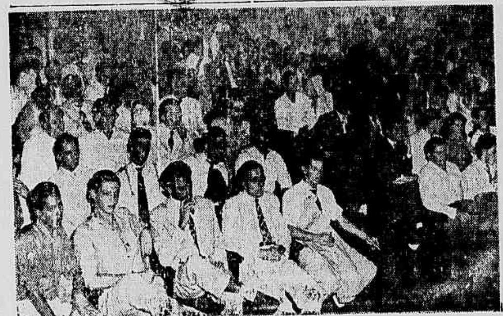
Aspecto da grande assembleia dos bancários

Diretor: PEDRO MOTTA LIMA IMPrensa POPULAR ANO VI — Rio, 19 de Janeiro de 1954 — N.º 1.706