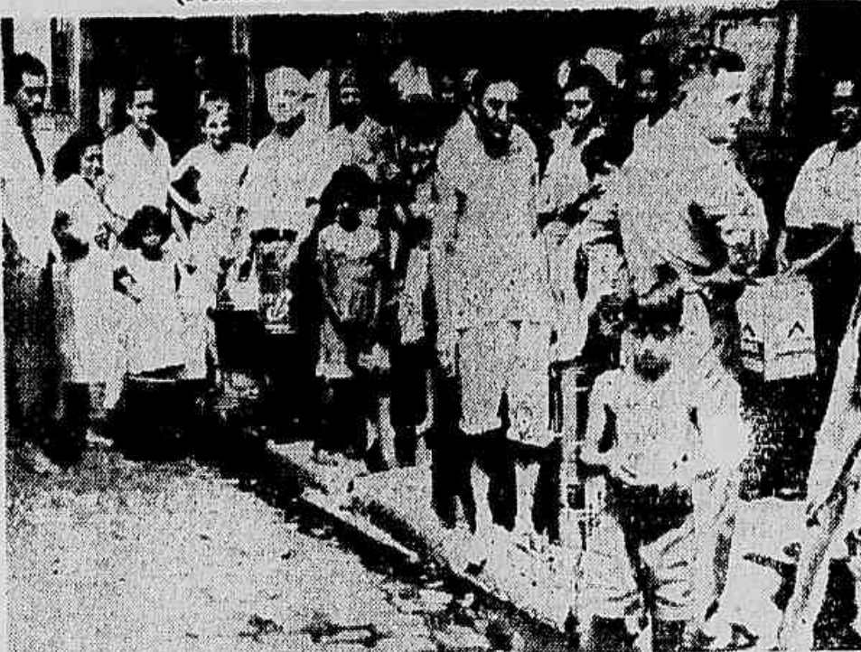
Nas zonas norte, sul, centro e nos subúrbios o drama é o mesmo: não há água nas torneiras nem para beber. E o responsável por mais essa desgraça é o governo cujas negociações impedem a solução dos problemas do povo