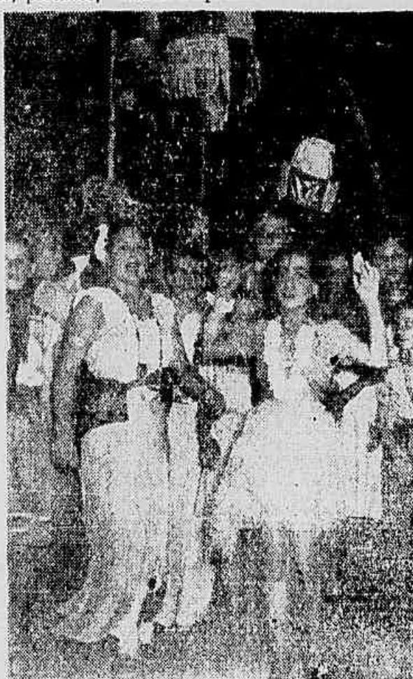
DOMINGO ÚLTIMO os “embaixadores” levaram ao centro da cidade a ritmo alegre e bulhoso do carnaval. Da esquerda o clube dos “embaixadores” o desfile foi um espetáculo, ocorrido precisamente quando no lado da água “belo-quiana” brincava o “brotinho” folião. E’ assim o carnaval. Não respeitando idade, nem condição social, vale como uma autêntica festa do povo.

Os “Turunas de Monte Alegre” receberam em sua sede social todos os associados da entidade dos cronistas carnavalescos. A recepção marcou a abertura do ano, além de um almoço, a realização de uma “batalha de confetes”.