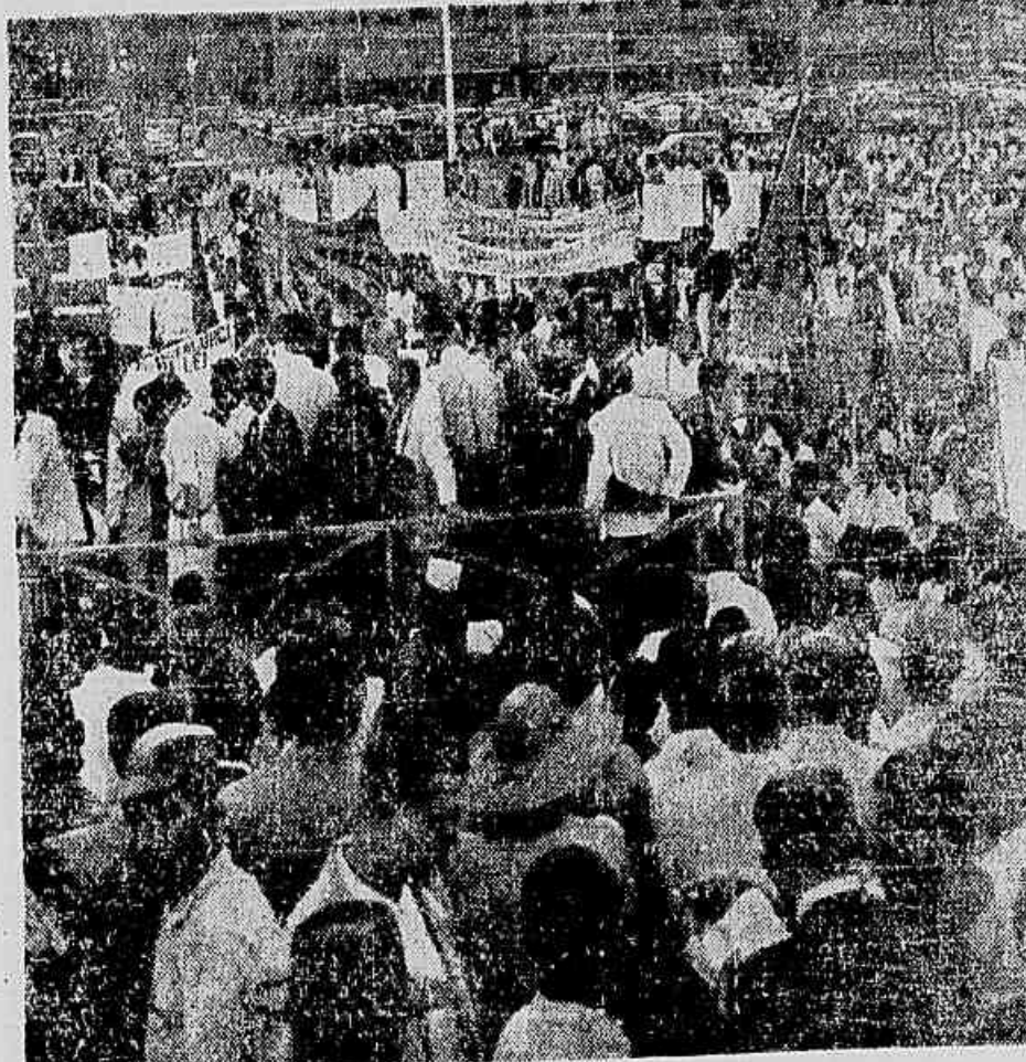
Do alto, aspecto do polânque e parte da assistência. Em baixo, delegações sindicais empunhando faixas e bandeiras

A pujante manifestação de ontem, da Esplanada do Castelo, representou uma séria vitória da unidade da classe operária. A concentração de quinze mil trabalhadores, ontem realizada nesta Capital, demonstrou que os trabalhadores se unem acima de diferenças ideológicas, em torno de suas reivindicações.