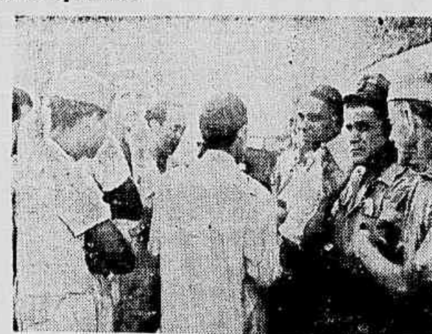
Operários do Moinho Inglês falando à IMPRESSA POPULAR

O objetivo da divisão era da evidenciou-se pela primeira vez há cerca de três me-