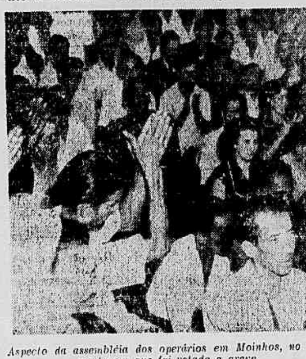
Aspecto da assembleia dos operários em Moinhos, no momento em que foi votada a greve