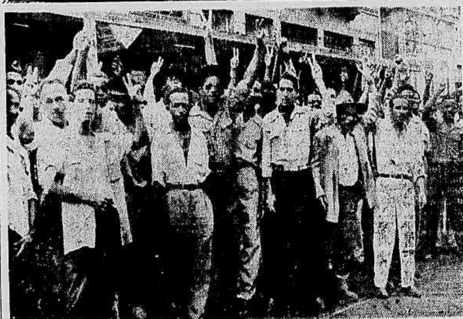
A massa de grevistas concentrada em frente ao sindicato, confiando na vitória que se aproxima

ANO VI — Rio, Quinta-feira, 4 de Fevereiro de 1954 — N. 1730