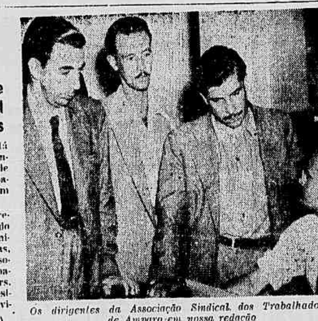
Os dirigentes da Associação Sindical dos Trabalhadores de Amparo em nossa redação