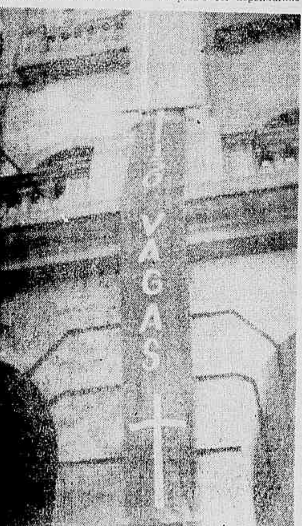
Na fachada da Escola de Engenharia, o crepe negro em sinal de luto por se haver cento e cinquenta vagas para os vestibulandos de engenharia

A Escola havia estipulado em 200 o número de vagas. O Conselho Departamental reduziu para 150. Imediatamente se formou na faculdade um movimento de protesto entre os estudantes. O Conselho alegava falta de verbas e os estudantes lutavam por maiores verbas para a Escola. (CONCLUI NA 5ª PÁGINA)