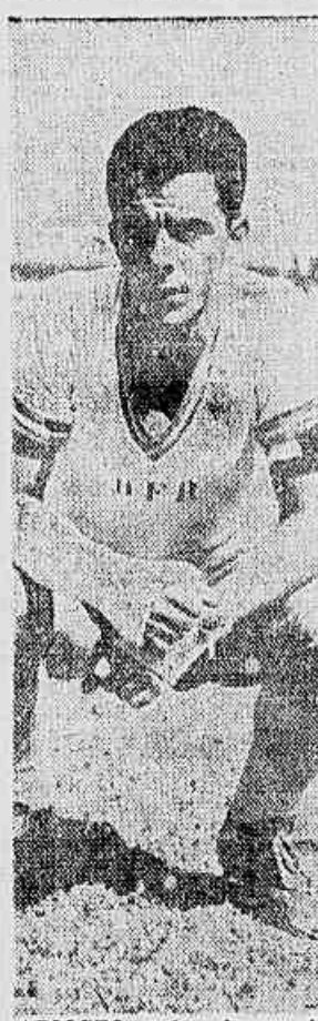
ARIOSTO, autor de um dos tentos da prática de futebol