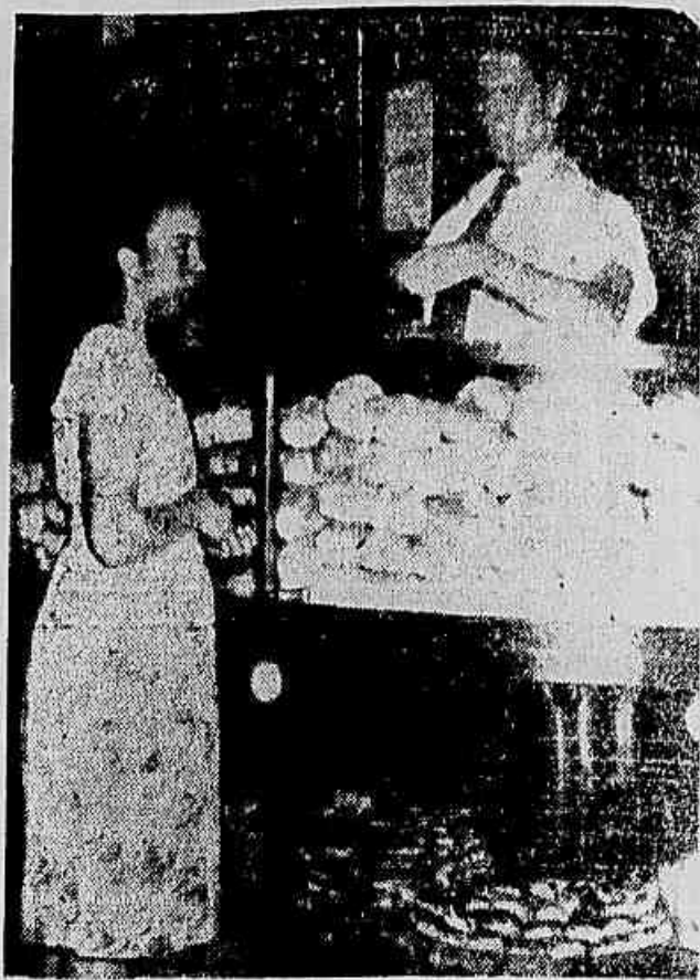
Também o pão subiu nestes três meses

Logo após a divulgação das bases do salário-mínimo proposto ao governo, Vargas fez elevar uma série de produtos essenciais — Do pão ao leite, dos remédios à gasolina, tudo subiu de preço — Somente o congelamento poderá anular tais assaltos