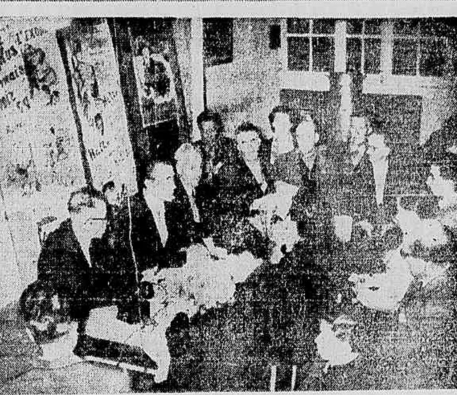
REUNE-SE NA CAPITAL, FRANCESA um Comitê Contra os Acordos de Bonn e Paris. O movimento contra o rearmamento alemão tomou, nos últimos dias, grande impulso em todos os países marxializados, a começar pela França, onde, comunistas, radicaes e deputados organizaram um comício-monstro, que se realizou domingo próximo. Durante essa manifestação, franceses de todas as tendências protestaram contra a política norte-americana de articulação de uma terceira guerra mundial, mediante o aproveitamento de restos dos exércitos de Hitler, cuja reorganização representa perigo mortal para a integridade dos países tradicionalmente vitimados pelo militarismo germânico.

há qualquer dúvida. A Guatemala acaba de dizer, pela voz de seu ministro do Exterior, que sua luta pela democracia, pela liberdade, pelas franquias individuais, pelos direitos do homem, é a luta de reivindicação contra os trusts, contra sua absorção por uma companhia todopoderosa (a United Fruit) que, através do ditatorialismo, se converteu numa espécie de minúscula para o capitalismo, para as explorações dos plutocratas norte-americanos. AMEAÇA AO BRASIL Após assinalar que não poderia haver mais tranquilidade: que nenhum povo poderia dormir tranquilo se fôr aprovada a tese de Foster Dulles, porque a intervenção armada poderia surgir de um momento para outro, desde que os trusts se sintam ameaçados, declara o senador português: — Imaginem um exemplo curial num futuro que poderá ser próximo: se o Brasil encampar a Light ou a Standard Oil, ou qualquer outra dessas companhias norte-americanas, logo se criaria um clima jornalístico de alarmismo. Possivelmente fariam conferências em que o leão rugiria e a voz do leão os outros animais, pálidos, se curvariam, obedecendo aos seus desejos. O MINISTRO E AS COMADRES... Sobre a atitude da delegação de Vargas, concluiu (CONCLUI NA 5.ª PAGINA)