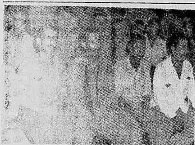
OS MOTORISTAS, TROCADORES E DESPACHANTES de ônibus estão com greve marcada para o dia 15, quando será deflagrada o movimento, caso até lá as empresas de ônibus não tenham pago o aumento de salários. O clichê mostra um aspecto parcial da assembléia realizada quinta-feira última, ocasião em que foi aprovada a decisão de greve.

Tudo pela tabela de 50 e 25 cruzeiros diários — Não aceitarão acôrdo em separado — Lição da última campanha por aumento de salários — O aumento é uma necessidade imprescindível — Lutar mais pelo novo salário-mínimo e exigir o congelamento de preços