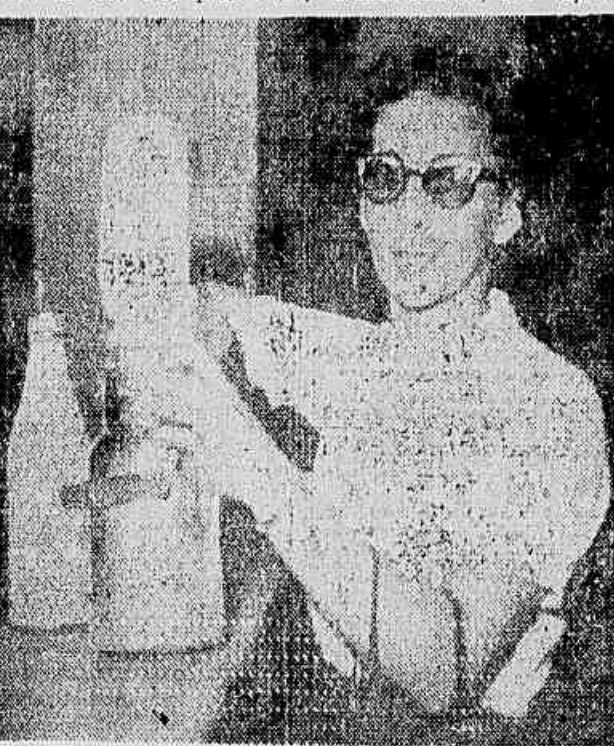
Uma dona de casa no posto n. 1 da CCPL protesta contra o aumento de preço do leite

tros produtos, como o leite, por exemplo, fundamental na alimentação do carioca, foi logo após a término de 1953, atingido por um brutal aumento de preços que o elevou de Cr$ 3,80 para Cr$