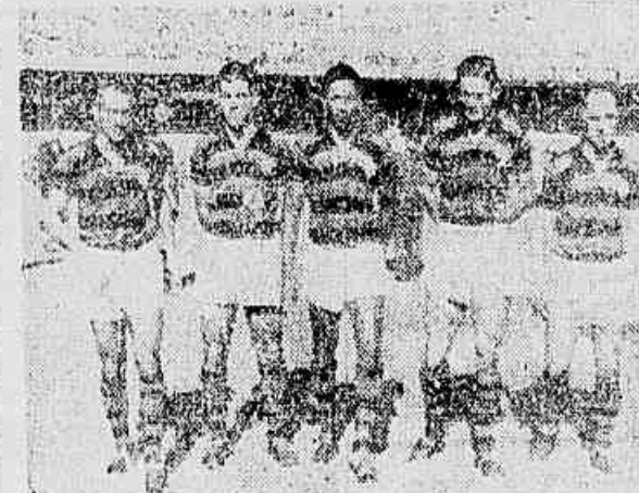
Linha atacante rubro-negra