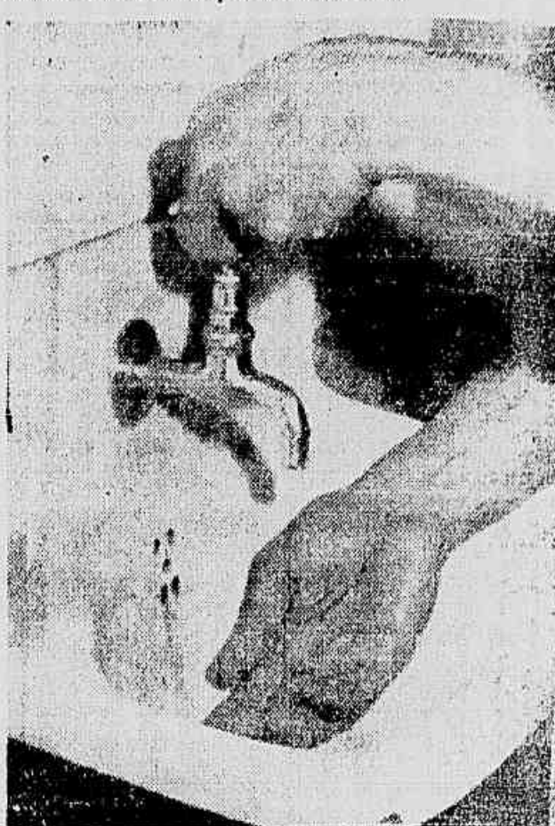
Um dia tem água, outro não tem e nem sempre o carioca sabe se vai poder levar as águas

O abastecimento para a cidade, Laranjeiras e outros bairros da Zona Sul é feito pela bomba elevatória de Guacurus.