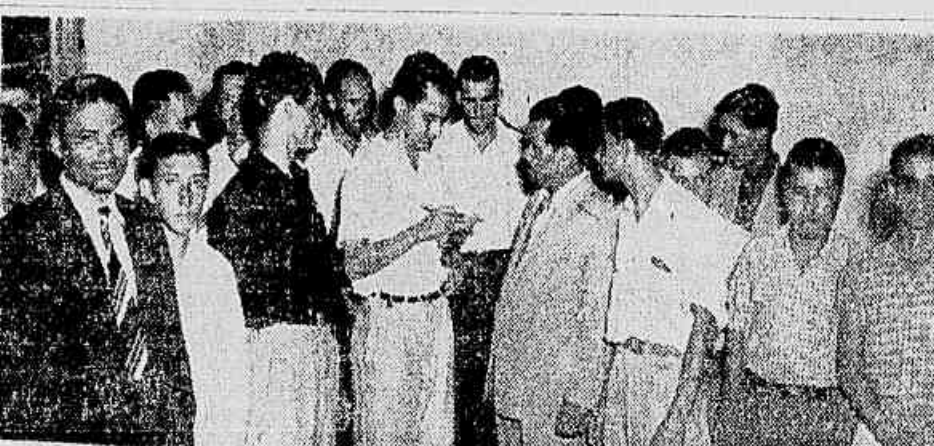
Entregadores de pão e padeiros ameaçados de desemprego total. Em sua sede de lucros os patrões não se importam com a sorte de mais de vinte mil trabalhadores chefes de família.

JUSTA A LUTA É, portanto, das mais justas a luta dos metalúrgicos pelo aumento de 50 e 25 cruzeiros mensais. Embora as três outras categorias já tenham conseguido aumentos e a de Mecânica e de Material Elétrico tenha ficado sozinha, ela conta com a solidariedade de toda a corporação e, caso deflagra uma greve na próxima assembleia, será com certeza vitoriosa. Ao seu lado também está a solidariedade dos demais trabalhadores e do povo.