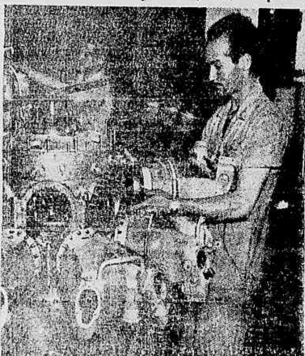
Este operário, trabalhando numa oficina de material elétrico, rende milhões de cruzeiros de lucro aos trustes iníquos, enquanto para si e sua família sobram miseráveis salários. E se reivindica algum aumento tem como resposta alegações de que «ainda não está em tempo» ou de que a «empresa está com prejuízo». Chantagens desse tipo, no entanto, já são conhecidas e repelidas pelos metalúrgicos.

Falsa e ridícula a alegação do Sindicato das Indústrias Mecânicas e de Material Elétrico — Cada operário produziu em 1953 para a General Electric mais de 751.551 cruzeiros — Demissões constantes e «prêmios de produção», expedientes para manter a exploração — Justa a luta dos operários