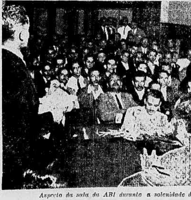
Aspecto da sala da ABI durante a solenidade da noite

FORAM apresentados ontem em grande ato público os candidatos de diversas corporações operárias para as próximas eleições. Numerosos trabalhadores reuniram-se no 7.º andar da ABI e um membro da comissão eleitoral de cada setor (marceneiros, têxteis, me-