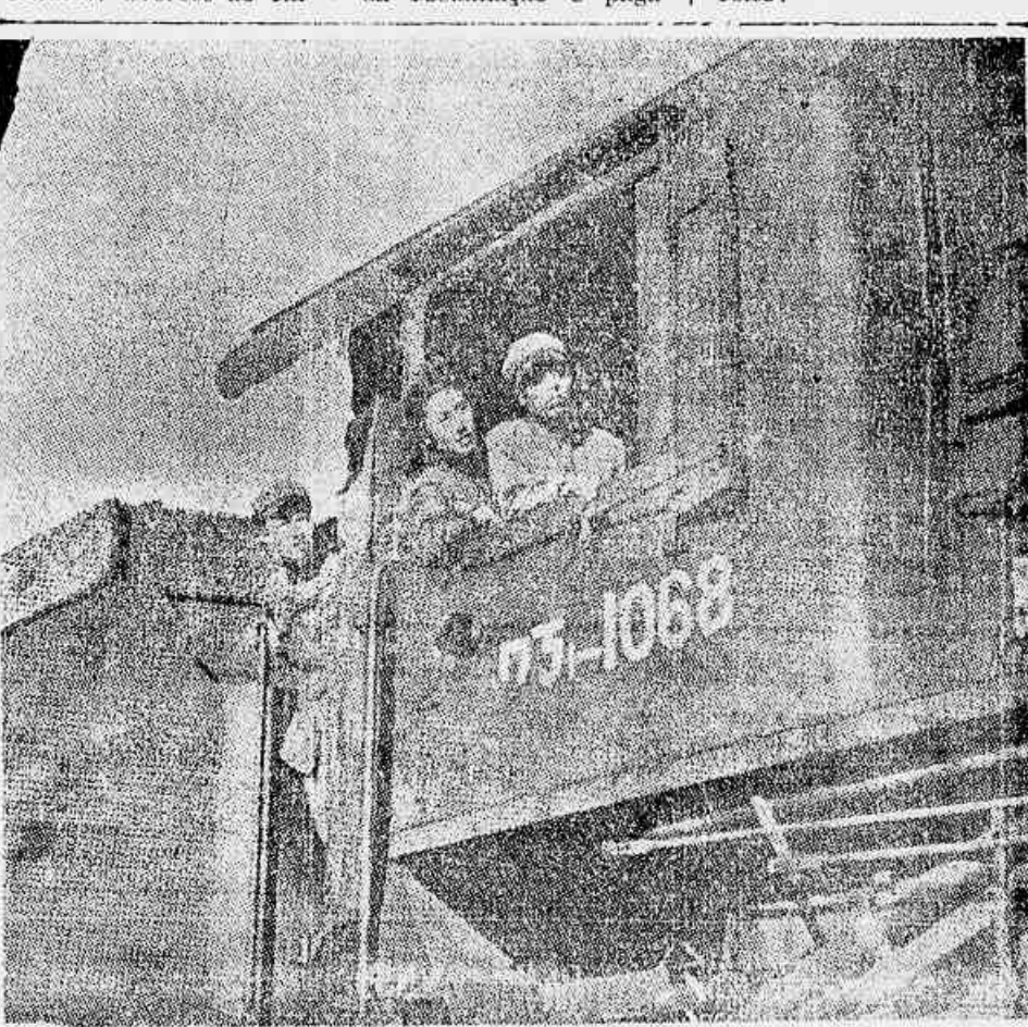
HOMENS E MULHERES, NA CHINA POPULAR, participam ativamente dos trabalhos de construção. As condições de absoluta segurança existente no trabalho, prova do carinho e cuidado do Estado popular para com os trabalhadores, permitem que as mulheres executem os mais diversos tipos de serviços, como por exemplo, o serviço ferroviário. No clichê, a tripulação de uma locomotiva realizando um exame ao longo dos trilhos.

mento de 50 por cento das indenizações. Este golpe está sendo repudiado pelos operários que exigem que os bens da empresa sejam penhorados, se necessário for, para pagamento das indenizações a que têm direito.