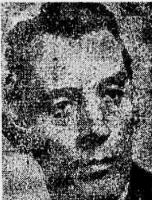
Joliot-Curie, presidente do Conselho Mundial da Paz