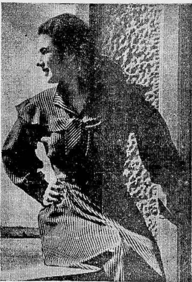
UM TAL STEFAN BACIU (UM REBUTALHO FASCISTA fugido da Rumania e asilado sob as asas do governo de Vargas) distillou ontem na «Tribuna da Imprensa» mais uma de suas provocações contra a URSS e as democracias populares. A última do provocador estepandiano: as mulheres do campo do socialismo só podem vestir «macacão»! A foto acima, de uma linda modelo das muitas casas de modas de Moscou, é uma resposta à provocação imbecil

Depois de ter afirmado que esse Congresso refletira em avançada crescente das massas que deviam impor uma modificação completa à política francesa, Maurice Thorez declarou que o Partido Comunista não pouparia nada para conseguir a reunião de todas as energias nacionais e democráticas. «Os comunistas — disse — devem redobrar de iniciativa, de perseverança, de esforços para ganhar para a frente única os trabalhadores e as organizações socialistas». Terminando, Maurice Thorez salientou a necessidade de manter, no seio do Partido, a unidade ideológica e a coesão.