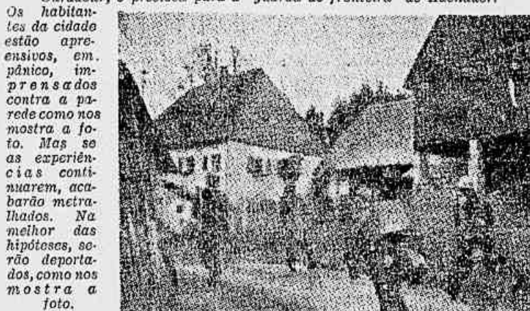
Os habitantes da cidade estão apreensivos, em pânico, imprensados contra a parede como nos mostra a foto. Mas se as experiências continuarem, acabará metralhada. Na melhor das hipóteses, serão deportados, como nos mostra a foto.

Estas fotos foram tomadas durante os exercícios da “guarda de fronteira”, formação paramilitar organizada pelos revanchistas de Bonn para ser o novo exército, e publicadas pela revista americana “Life”. Guarda de fronteira? Trata-se, isto sim, de um ataque a uma cidade. A experiência dos antigos nazistas da divisão “O Reich”, que incendiaram e inundaram do sangue Ouradour, é preciosa para a “guarda de fronteira” de Adenauer.