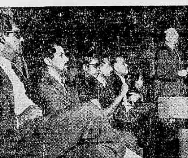
Aspecto do concorrido ato eleitoral de sábado, na ABI, quando falava o deputado Roberto Moreira

— Esse trabalho de união, aqui no Distrito, poderá ser tomado como exemplo para todo o país.