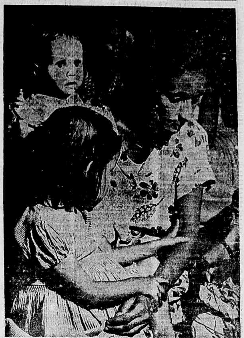
No governo Vargas começa na infância a luta contra a miséria

SABEREMOS RESPEITAR Depois de muitos protestos (CONCLUI NA 5ª PAG.)