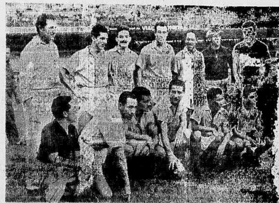
Este é o quadro do Milionários, que deverá perder muito do seu poderio, com a saída dos seus principais «astros».