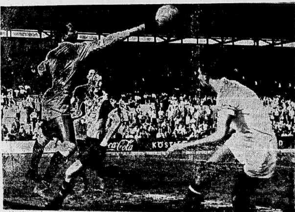
Estão os tricolores cumprindo um vasto programa de excursão, atuando por diferentes países. O flagrante acima focaliza uma das pelejas do Madureira A.C. na Alemanha Ocidental, mais precisamente na cidade de Munich. Observa-se íntegro em plena ação, reba-tendo de soco, ao ser acossado por um atacante germânico, permanecendo Deulene na expectativa. Até agora, sem ser das mais destacadas, a campanha dos pupilos de Plácido tem convencido favoravelmente.