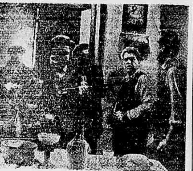
Uma cena de "Os Implacáveis", filme italiano, dirigido por Camillo Mastrocinque