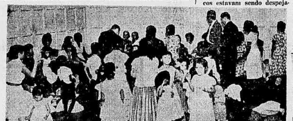
A sala de imprensa da Câmara Municipal foi inteiramente ocupada pelas esposas e filhos dos favelados

— Essa proposição — disse o general Lino Machado — merece ser aprovada; ela lida com as injunções políticas que não raro se observam com o fim de impedir o funcionamento legal de agremiações partidárias. Assim aconteceu com o Partido Comunista do Brasil, que deve, como exigência da própria democracia, voltar a