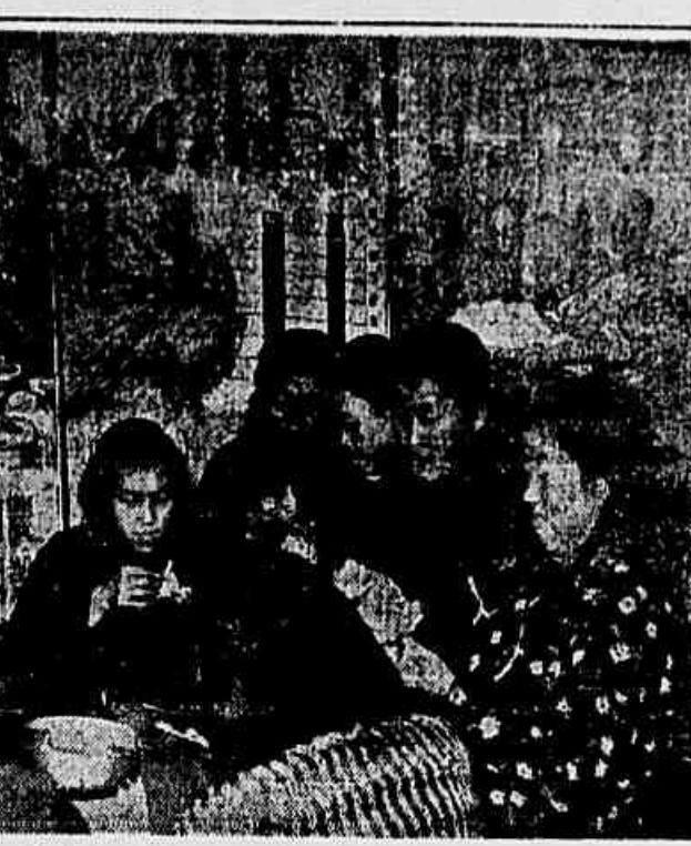
Os artigos 94 e 98 da nova Constituição da China asseguram toda proteção aos jovens, mulheres e crianças.

Contudo, a greve de fome continua. Os presos se mantêm na disposição de não tomar alimento desde que não forem transferidos para celas dignas com a condição humana. Ontem, arbitrariamente, as visitas foram proibidas. Por outro lado, a situação dos presos piora dia a dia. Passando por grandes necessidades, alguns têm sido atingidos por causa dos tratamentos recebidos.