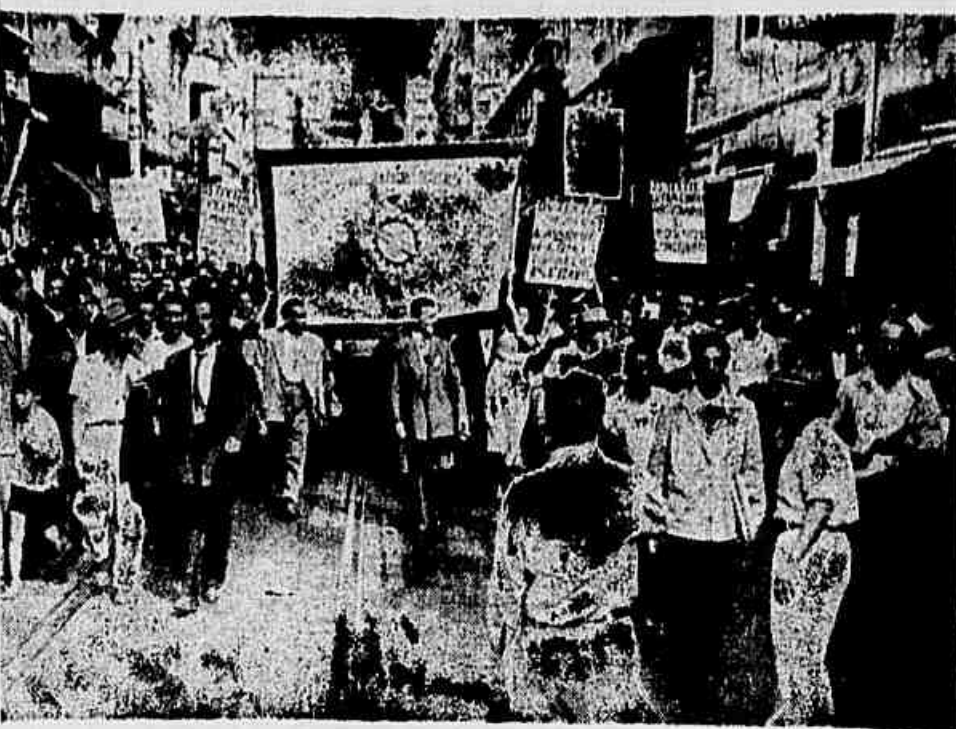
Com seus líderes à frente, os trabalhadores paulistas saíram em passeata pelas ruas para o comício no Largo do Arouche, pelo salário-mínimo e o congelamento. Conquistado o salário-mínimo, o proletariado paulista faz crescer dia a dia sua unidade, lutando agora pelo congelamento e por um reajustamento para os que não foram diretamente beneficiados pelo novo salário-mínimo.

Acrescentou ainda o presidente da Chapa Unidade: — Precisamos também nos integrar, imediatamente, na luta pelo congelamento dos preços. Essa é uma reivindicação de todo o povo e nossa também. Chega a ser mesmo tão importante quanto o próprio aumento de salário, pois este ficaria anulado se o povo não conseguir deter a carestia.