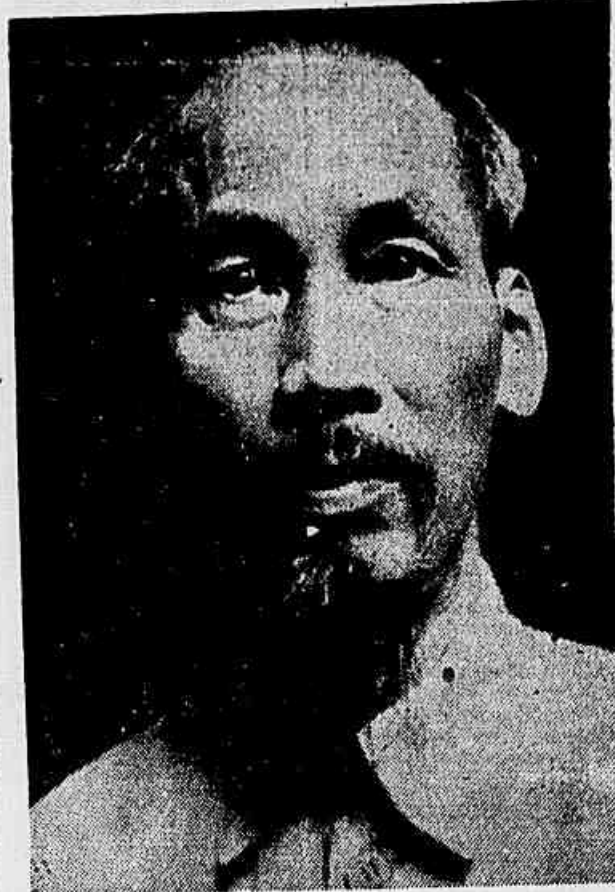
HO CHI MINH

caminho para o restabelecimento da paz. Nessa base, se a outra parte desejar negociar sinceramente conosco e se desejar pôr fim às hostilidades, poderá ser restabelecida a paz na Indo-China. Na conformidade da nossa posição inquebrantável, a República Popular do Viet-Nam continuará lutando (CONCLUI NA 5ª PÁG.)