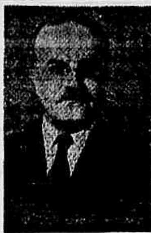
MOLOTOV, ministro soviético

Poi esta a primeira vez que uma mulher sofreu a pena capital.