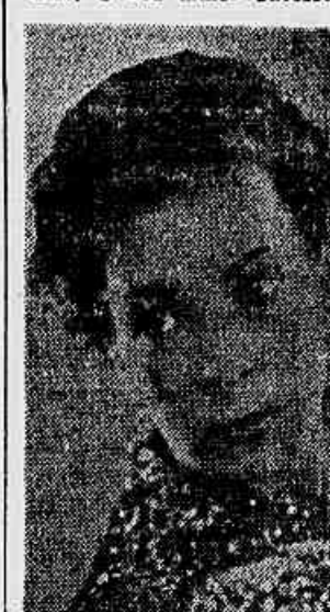
Elizete Cardoso. "Bossa" e personalidade em favor da música popular brasileira.

A moça, reservada, fala pouco. Não é de se entregar a grandes publicidades, não possui clube. Contudo, é uma das grandes cantoras populares brasileiras. Há gente que a aponta mesmo como a maior cantora moderna do Brasil. O seu nome: Elizete Cardoso. O seu maior sucesso: