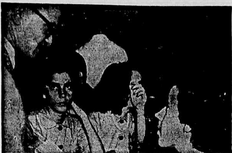
Neusa e Ariete ganham salário-mínimo e comissão, mas, afirmam: — Isso nada adianta. Quanto mais ganhamos, mais pagamos também. Os salários devem subir, porque são baixos, mas os preços que ficam onde estão.