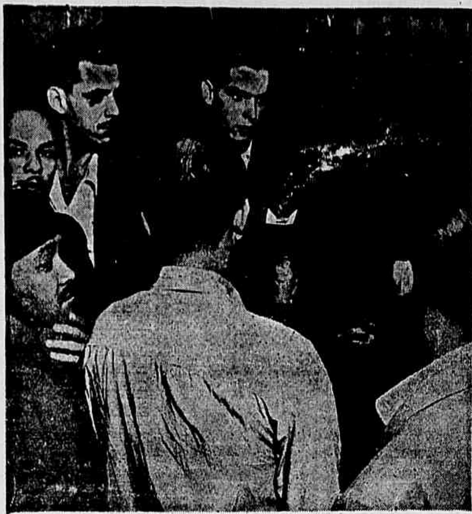
"É uma necessidade inadiável o congelamento dos preços" afirma o operário da HIME