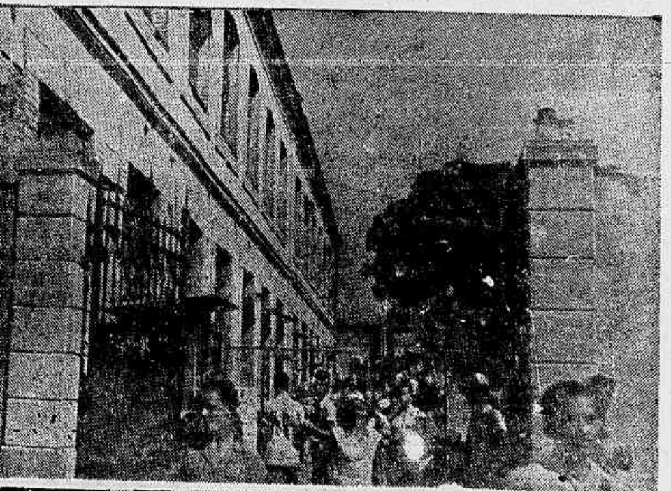
A "raibona" Companhia, fazendo uma série de manobras, entre as quais a conjeção de uma nova "tabela" para os tarefeiros, visando burlar o cumprimento da nova Lei do Salário-Mínimo. Na sexta página publicamos detalhada reportagem em que a Comissão de Fábica da empresa manifesta sua disposição de impedir o golpe planejado. No alto vemos os tarefeiros quando saíram da fábrica para o almoço. Em baixo, alguns operários isolando a IMPRENSA POPULAR.