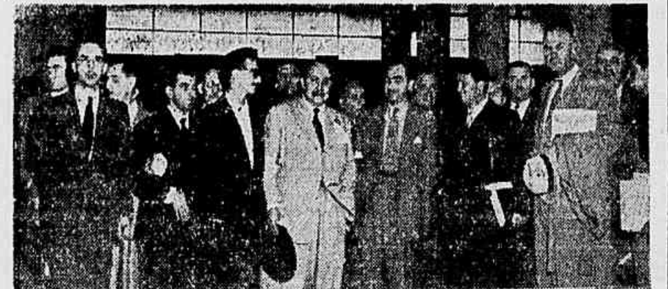
Momento em que os cientistas soviéticos eram recepcionados no Aeroporto Santos Dumont por um grupo de médicos brasileiros.