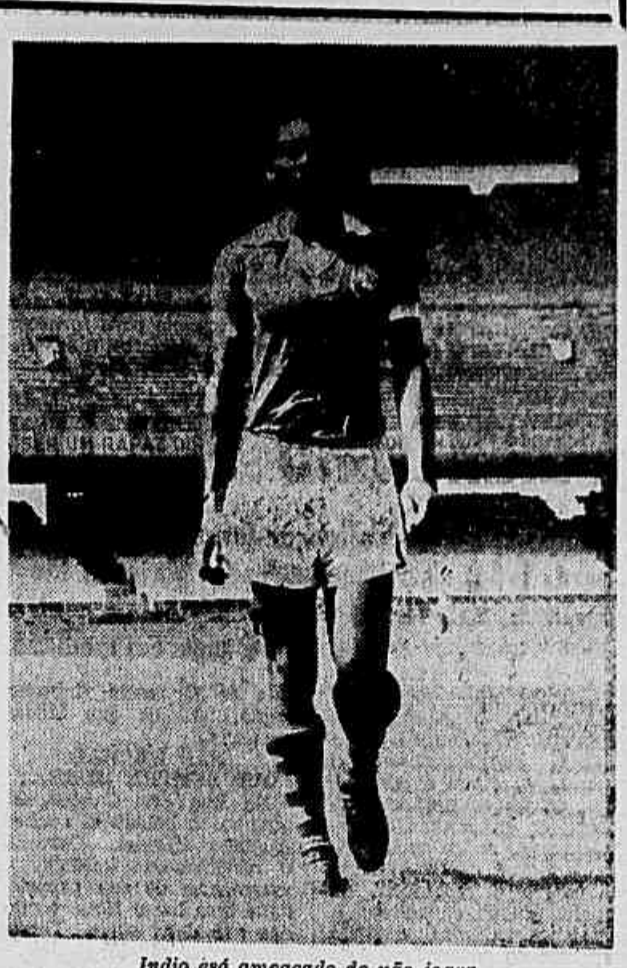
Índio está ameaçado de não jogar

O início do prélio está previsto para as 15.30 horas.