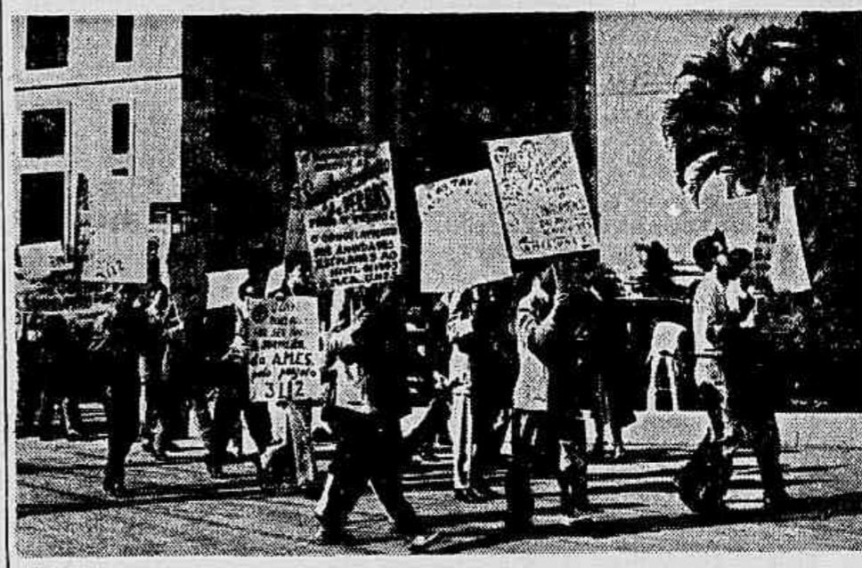
Detalhe da manifestação, quando estudantes de vários colégios chegavam, com seus cartazes, à Câmara dos Deputados