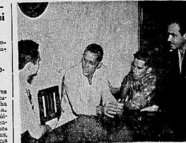
Os marinheiros do navio «Macau» quando, em nossa redação, falavam ao nosso repórter

Na grande Convenção Sindical realizada no Rio foi acolhida com aplausos a delegação de solidariedade à Conferência, sendo escolhida uma delegação de cinco delegados sindicais que representarão a Convenção na Conferência dos Camponeses e Trabalhadores Agrícolas. Além desta representação, sindicatos cariocas, como o do marceneiros, enviarão representantes seus.