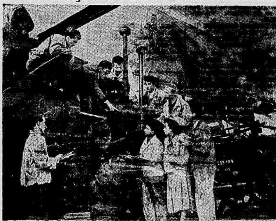
Com a instalação do regime democrático-popular na Rumânia foi criado o Instituto Agrônomo de Craiova, o qual, dotado de todas as máquinas modernas, vem preparando intensamente os futuros técnicos da mecanização agrícola. Na foto, uma aula prática da mecanização dada no referido Instituto. Com o aumento das estações das máquinas agrícolas vem o governo de Georgehe Pheorghiu de incrementar e desenvolver a agricultura do seu país que já atingiu a duas vezes e meia a produção de 1939.