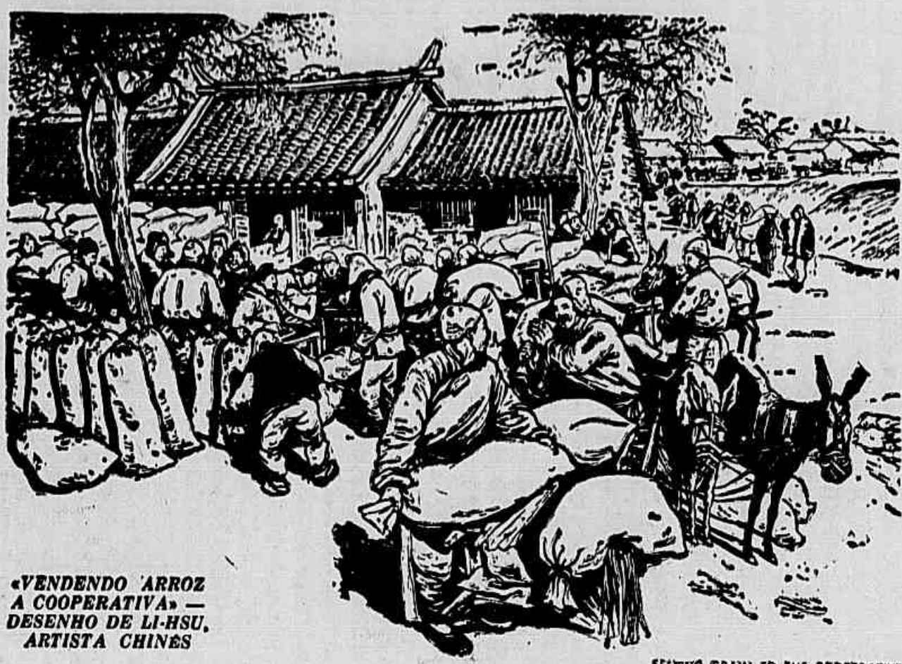
«VENDENDO ARROZ A COOPERATIVA» — DESENHO DE LI-HSU. ARTISTA CHINES