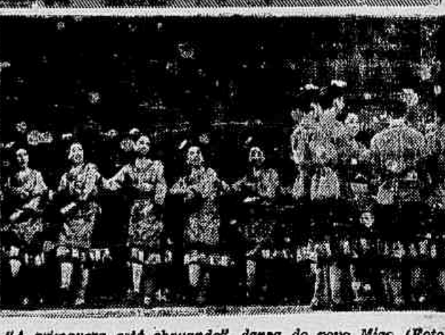
«A primavera está chegando», dança do povo Miao

No passado, devido à miséria e às péssimas condições sanitárias, as enfermidades assolavam a ilha e a mortalidade infantil era alta (às vezes alcançava 58 por cento). A partir da libertação, foram organizados centros de saúde e clínicas em todos os condados e distritos. Com a ajuda da Cruz Vermelha Chinesa, os funcionários da saúde pública foram enviados aos mais longínquos rincões da ilha para realizar os trabalhos de vacinação do povo. Graças ao melhoramento das medidas sanitárias, as epidemias que antes dizimavam o povo encontram-se hoje, pela primeira vez na história sob controle. Os modernos métodos obstétricos e as melhores condições sanitárias reduziram a taxa de