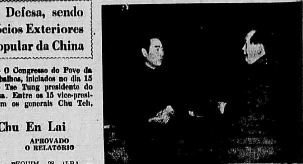
Mao Tse Tung e Chu En Lai

GRAZ, 28 (AFP) — Dois jovens iugoslavos, um mecânico e um electricista cujos nomes ainda não foram revelados, aterrissaram hoje, a bordo de um avião de turismo, no aeródromo de Graz (Styria), na zona britânica. Os dois refugiados, ao descer do avião, declararam que haviam roubado o aparelho hoje de manhã no aeródromo de Maribor (Iugoslávia do Norte). Os dois jovens, que desejam emigrar para a Austrália, pediram o direito de asilo às autoridades austríacas, que os entregaram às autoridades britânicas do aeródromo de Graz, à espera de uma decisão a seu respeito. Os refugiados teriam deixado o seu país em consequência da má situação econômica.