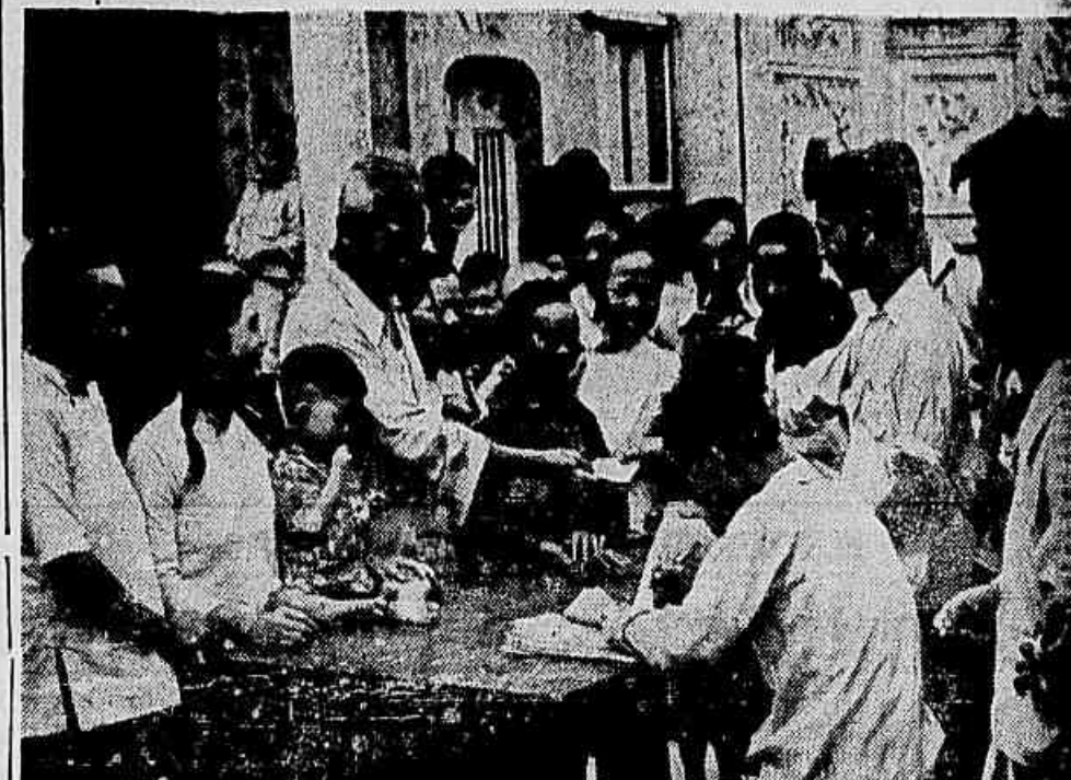
Pólo eleitoral na cidade de Chingking, na Província de Fukien.

PEQUIM (I.P.) — Está sendo exibido simultaneamente em todas as cidades principais do país um filme documentário sobre a primeira eleição geral da China. Intitulado «Voto solene», o filme recorda vividamente a alegria e o entusiasmo com que foi às urnas o povo das mais diferentes camadas sociais do país inteiro. Mostra como o presidente Mao Tse Tung e seus mais íntimos colaboradores votaram na capital. Destaca também o apoio entusiástico que receberam da população os operários exemplares Meng Tai e Chang Ning-shan da usina de aço de Anshan e o camponês Keng Chaw-sho de Hopel elegendo-os deputados populares.