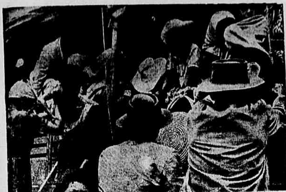
Assim são os «pau de arara», símbolo do trabalho escravo em nosso país. Mal chega da longa viagem o caminhão já um guarda sobe ao estribo e leva os retirantes à Hospedaria que é um entreposto do latifúndio onde vai trabalhar como escravo.

Em certo ponto acrescentou: «Há um mês, encaminhamos à Light um pedido de elevação de nossa cota. Pretendemos desenvolver nossa produção e isso seria fácil se tivéssemos garantido o for-