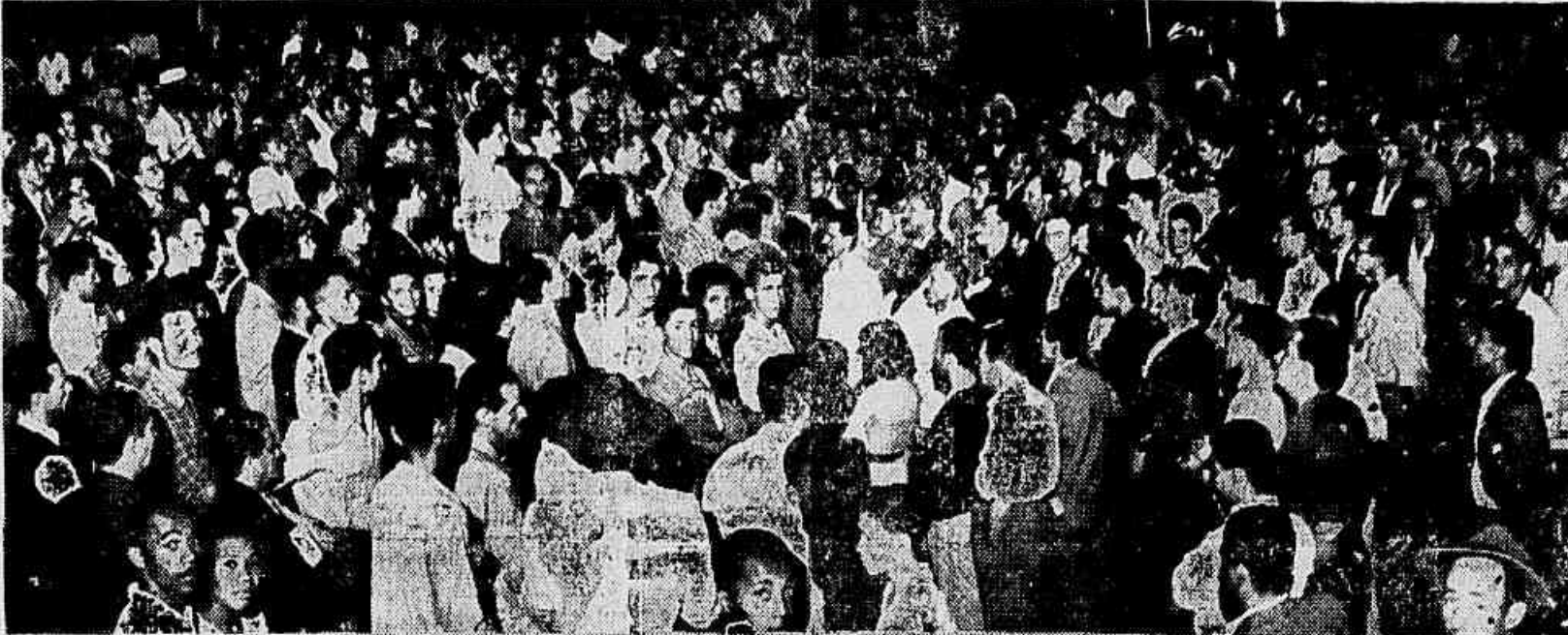
Na praça das Nações, em Bonsucesso, Bruzzi realizou ontem à noite entusiástica manifestação, de que se vêem aspectos, no clichê. O trânsito foi interromvido. Das casas partiam aplausos aos oradores.

445 quilômetros quadrados do território nacional para a infame colonização americana — Audaciosa medida antinacional da ditadura vende-pátria de Café, Juarez e Brigadeiro — Nosso povo deve repelir com veemência e indignação patriótica a ignominiosa concessão