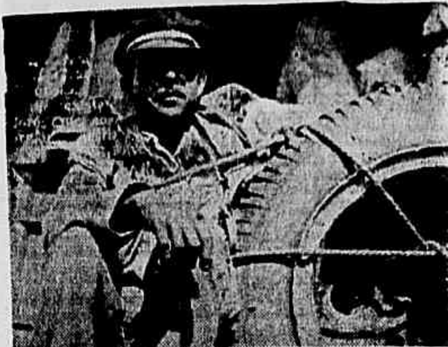
Ald amarrados à corda vêm para os centros populistas do sul do país os nordestinos vendidos como escravos. A plagem é arriada e o pobre passageiro não sabe ao chegar viver ao seu destino