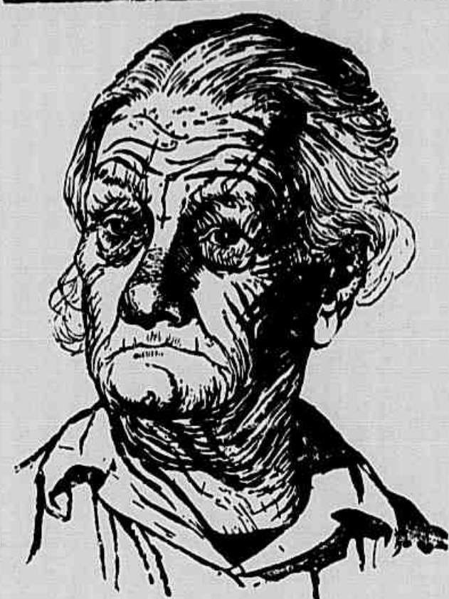
RETRATO — gravura de Carlos Manchado, do Clube de Gravuras de Porto Alegre