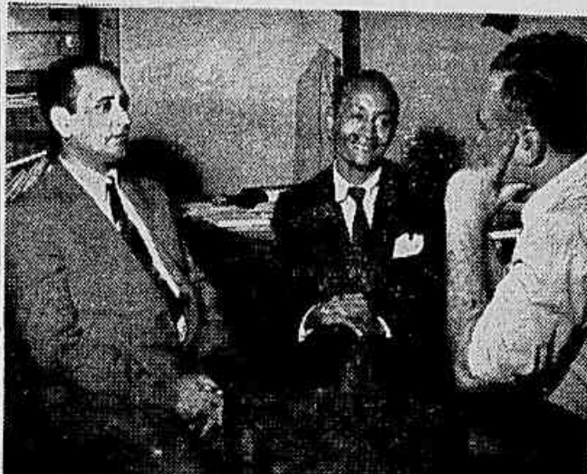
Os delegados de Pernambuco e Minas transmitem suas impressões da Conferência ao redator da IMPRENSA POPULAR

A maior delegação foi a de São Paulo, com 155 membros, mas todos trabalharam com entusiasmo e dedicação mais ou menos idênticos. Na sessão de encerramento, que foi filmada, teve caráter festivo e solene, quando falaram vários delegados operários com representação dos seus sindicatos. Falou na ocasião, também, tendo feito parte da mesa, o padre Rubens Dias Maia, que saudou o bom êxito da Conferência, afirmando que eram justas as reivindicações dos camponeses.