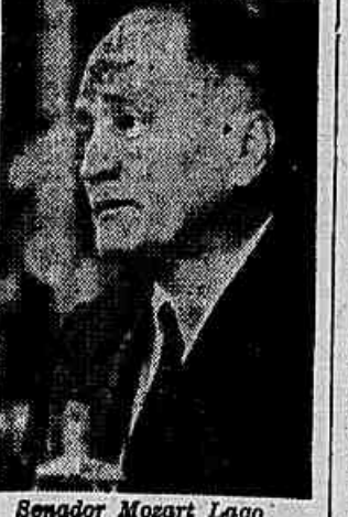
Senador Mozart Lago