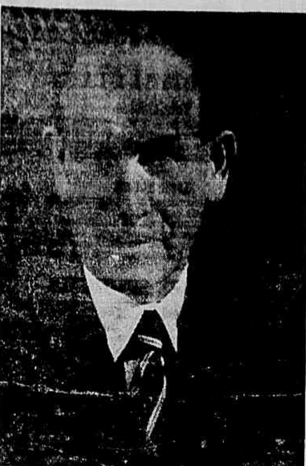
Zapolocky, Presidente da Tchecoslováquia

A nova instalação, além de contribuir para elevar o nível de higiene do trabalho, traz grandes benefícios à economia nacional, uma vez que extrai grande quantidade de matérias primas das emanções de fumo. De apenas um forno siderúrgico, essa instalação recolhe cerca de 30.000 quilos de carvão em pó num só mês. A máquina, de construção extremamente simples, começará a ser produzida em série após as experiências com o protótipo.