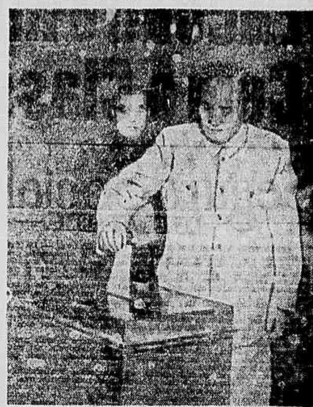
Milhares de trabalhadores das cidades e dos campos compareceram às urnas para eleger livremente, pela primeira vez na história do país, os seus representantes locais, provinciais e para a Assembleia dos Representantes Populares da China. Instalada em 15 de corrente, a Assembleia aprovou a nova Constituição Chinesa e elega o Governo Central Popular. Mao Tse Tung, eleito Presidente da República Popular da China, quando depositava seu voto na urna durante uma votação no Congresso do Povo Chinês.

Em agosto último o chefe do governo federal havia cogitado de ir a Washington por ocasião do Congresso da Legião Norte-Americana. Esse projeto, que suscitara alguma surpresa nos círculos diplomáticos estrangeiros, teria de ser abandonado. Por outro lado nesse momento o presidente Eisenhower, que Adenauer se propunha encontrar, estava em férias.