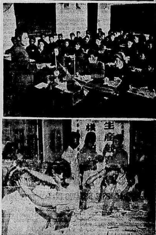
Al lado do desenvolvimento da produção, floresce a vida cultural dos operários chineses. Os operários técnicos da Changai organizaram mais de quatrocentos grupos amadores de teatro, canto coral, dança e artes plásticas. Nos flagrantes aparecem (primeiro) operários assistindo aula numa escola secundária para trabalhadores em Wuhan, e, abaixo, trabalhadores do grupo da Fábrica de Algodão do Estado n. 19, em Changai

A bomba havia pertencido a um depósito de munição que explodiu há uns dez anos.