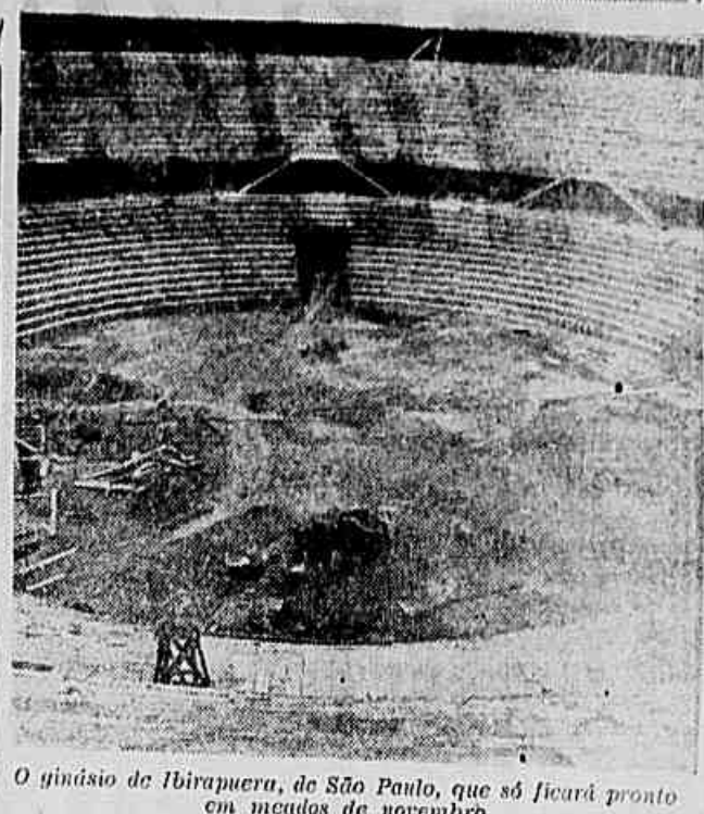
O ginásio de Ipiranga, de São Paulo, que só ficará pronto em meados de novembro.