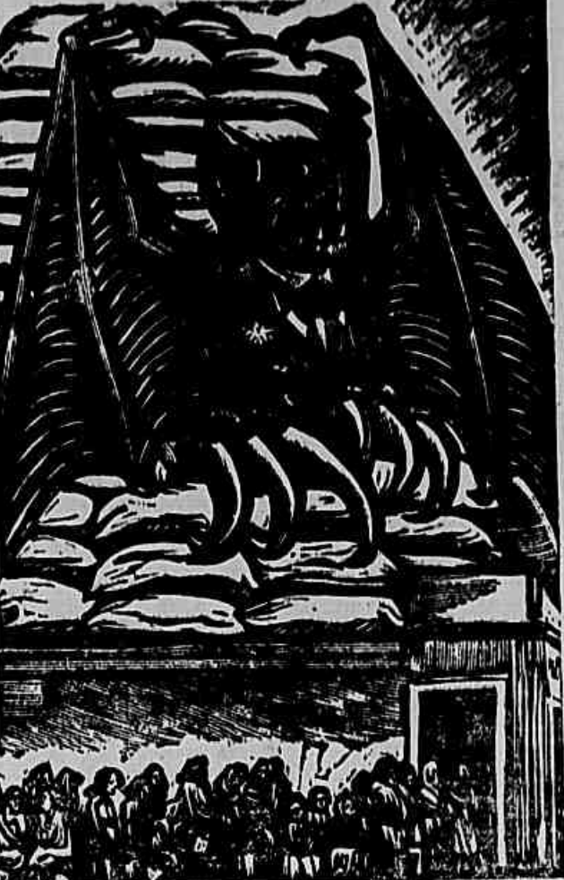
O MONOPOLIO — gravura de Leopoldo Mendez, do Taller de Arte Gráfica do México

Av. Eriberto, 299 - 8.º andar - Telefone 42-7189