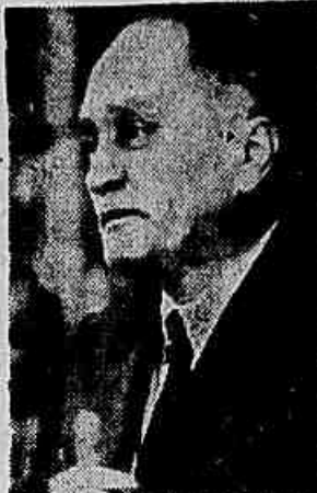
Senador Mozart Lago

de Oliveira continuam melhorando sua posição. Alcides Miguel de Oliveira já se encontra praticamente eleito, com