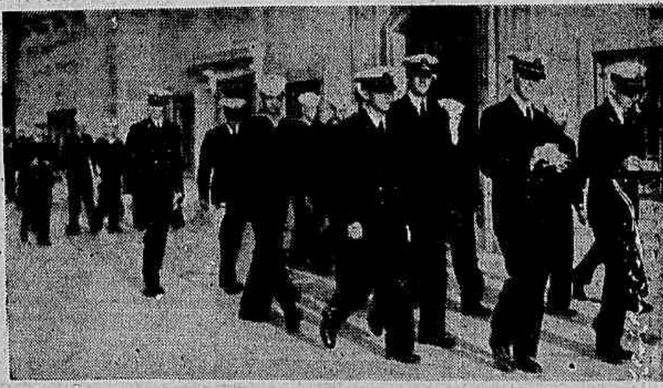
Ves em quando levam marinheiros ianques descem em território brasileiro, portando-se como em país ocupado. Mas, permanentemente, um numeroso contingente de oficiais ianques é encontrado no Ministério da Marinha, no Rio, onde ditam ordens a chefes da Armada brasileira.

Metade de um andar no edifício do Ministério da Marinha está ocupado pelos olímpicos oficiais da Missão Naval Americana. Na Lista de Assinantes de Telefones do Distrito Federal de 1953, pode-se verificar que cinco telefones são destinados ao uso exclusivo da Missão. Um