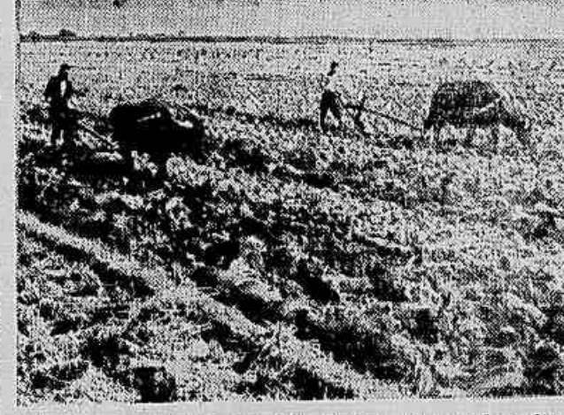
Camponeses de Lug Tou Han Hsiang preparando a terra para o cultivo de inverno. (Foto Sin-Hua, distribuída pela INTER-PRESS).

Foram plantadas árvores em 210.000 hectares na par-