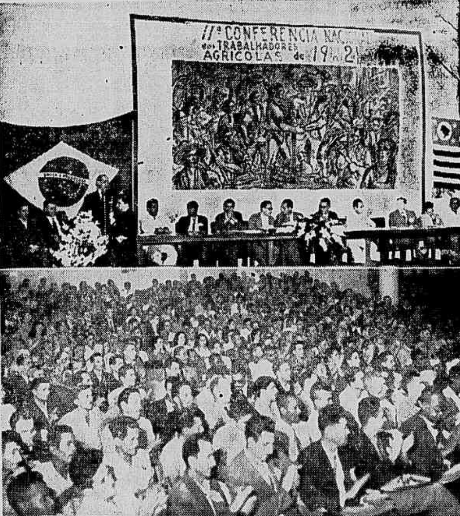
A Conferência Nacional dos Trabalhadores Agrícolas, realizada em São Paulo, foi a maior assembleia camponesa já realizada no Brasil, com a presença de delegados de quase todos os Estados e regiões do país. A Conferência lançou as bases da Associação Nacional dos Trabalhadores Agrícolas, que congregará todas as associações camponesas e entidades de trabalhadores rurais existentes no país. No clichê, fotos do encerramento do magnífico conclave.

tudo molhado. A saúde do trabalhador lá se vai, diariamente, enquanto o bolso do patrão cada vez cresce mais. Certos trabalhos que exigem proteção de máscaras não são feitos de acordo com a lei. Não há máscaras. Os fiscais do Ministério do Trabalho até hoje não se deram por achados. Mas com o nosso movimento de protesto a sôpa vai acabar. São péssimas as condições de trabalho. Por hoje, basta o que narramos. Diremos mais, posteriormente, a respeito das ameaças e perseguições que são levadas a cabo contra os menores.