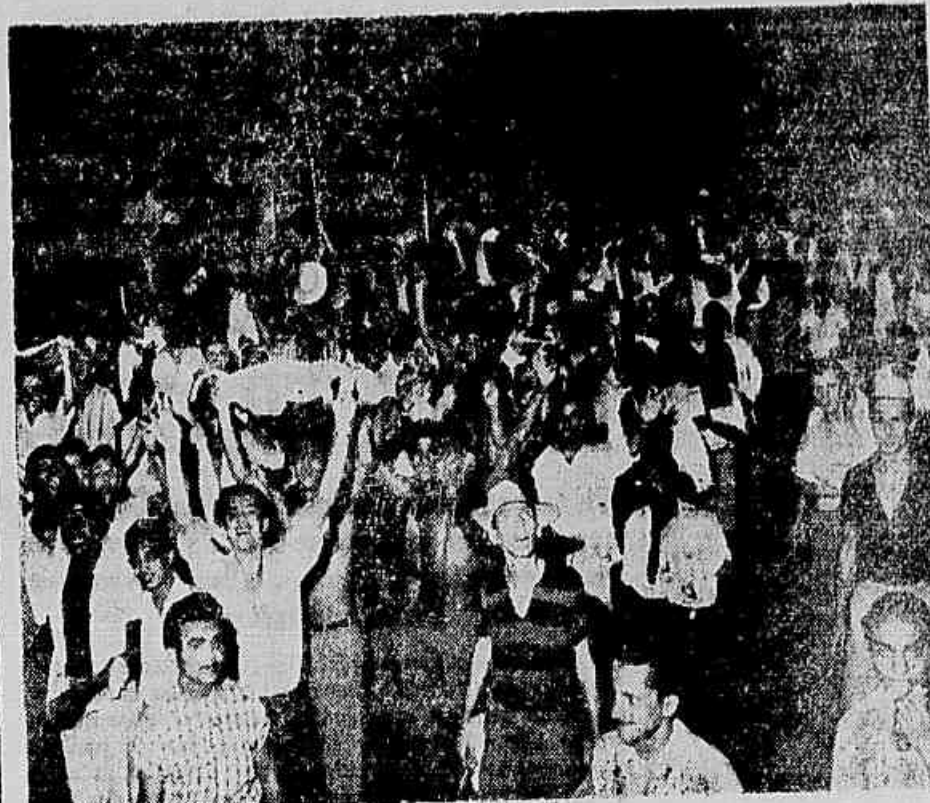
O flagrante focaliza a entusiástica torcida do Flamengo, após a sensacional vitória do clube rubro-negro, domingo último, sobre o Vasco. Sempre que triunfa o Flamengo, essa torcida imensa, colossais, faz o seu carnaval pelas ruas do Rio de Janeiro. É que o Flamengo é o clube mais popular do Brasil.