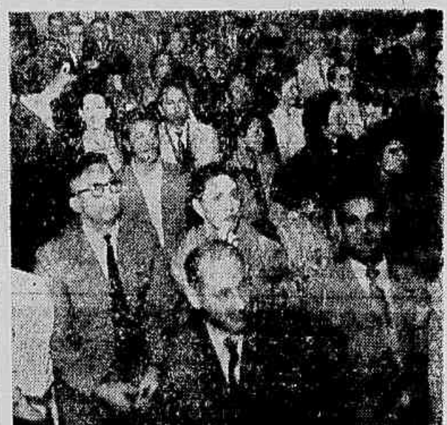
Grande número de associados esteve presente à assembleia de ontem dos empregados em empresas cinematográficas.

animos, foi, por fim, feita a votação, quando grande parte do plenário já havia ido embora.