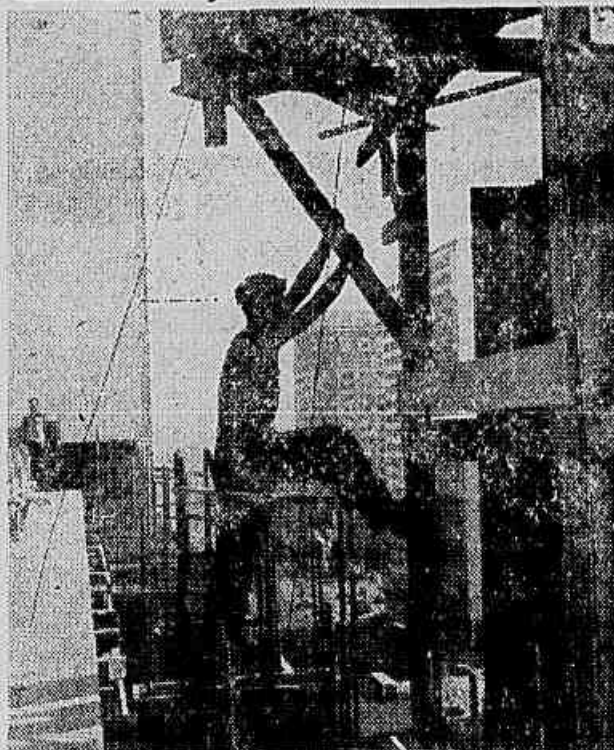
Milhares de operários da construção civil se encontram, neste momento, sob ameaça de desemprego. Resultado da política do governo Café-Juarez-Gudin.

E concluiu: — 120 mil operários da construção civil, só no Distrito Federal, estarão ameaçados se o governo não modificar sua orientação.