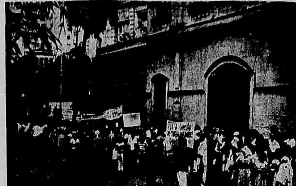
Depois da concentração no Palácio do Catete, os favelados dirigiram-se em passeata, até a Câmara Municipal