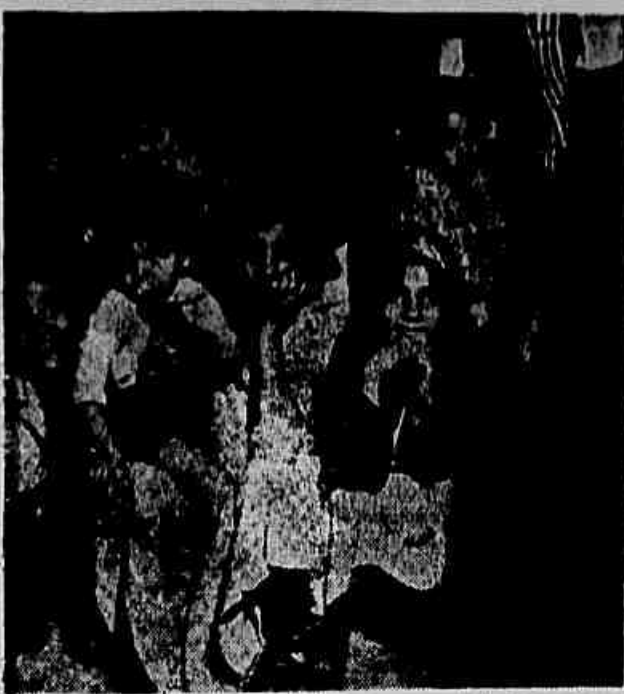
Até as crianças desceram do morro para exigir dos poderes públicos que respeitem o direito do povo de abrigar sob um teto.