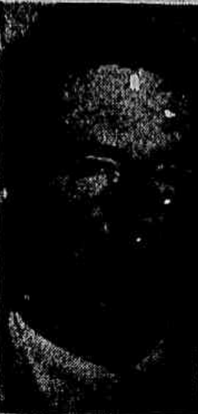
ADEMAR DE BARROS

de de ser decretada, dentro de poucos dias, a prisão preventiva do sr. Ademar de Barros, que, entretanto, poderá ainda requerer novo "habeas-corpus" à mais alta corte de justiça do país.