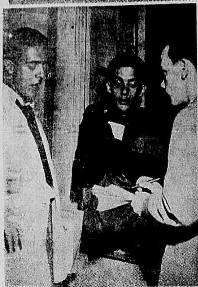
Estudantes da Faculdade Nacional de Direito falam à IMPRENSA POPULAR sobre o pedido de aumento das passagens de bondes. Todos são unânimes a condenar o assalto.