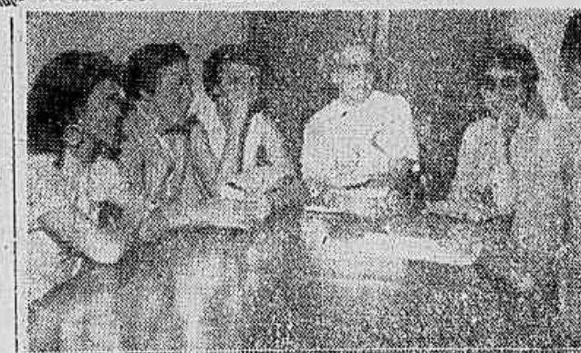
Senhoras, membros da União Feminina de Tijuca e Vila Isabel, quando falavam ao repórter, em nossa redação.

Será realizada no dia 17, na ABI — Senhoras protestam contra os aumentos dos preços — Instalação da sede e posse da diretoria da U.F.T.V.I.