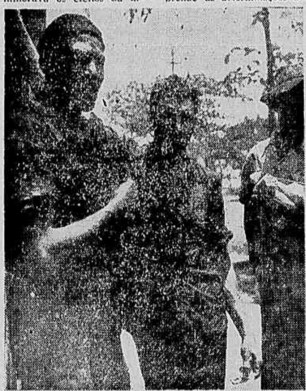
Três operários do "pó preto" nos portões da "Pneus Brasil".

Na realidade, a Pneus Brasil é um verdadeiro cemitério. Na próxima e última reportagem desta série, que publicaremos amanhã, abordaremos mais alguns problemas de seus operários e particularmente a luta em que estão empenhados para resolver os.