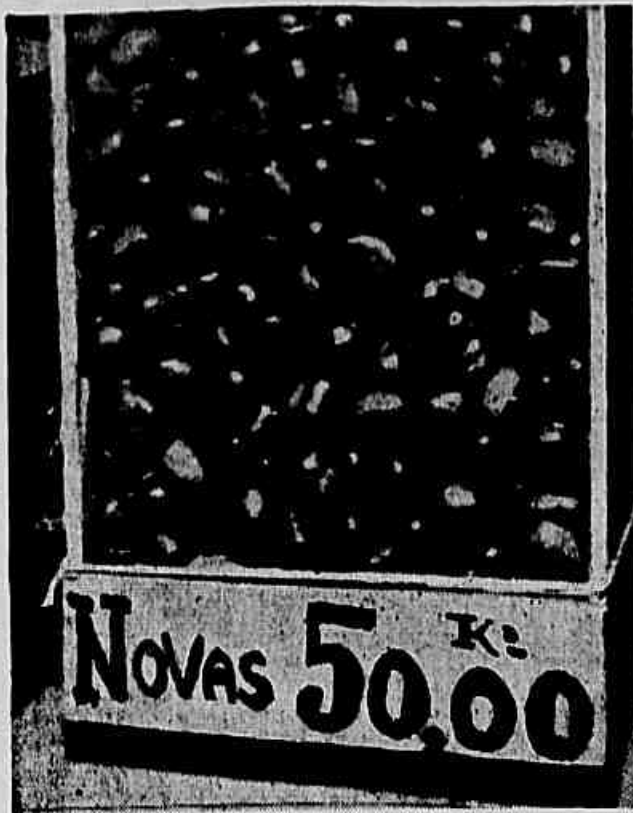
Castanha, o mais tradicional dos artigos de Natal está a 50 cruzeiros. Os altos preços fixados no leilão de produtos para a importação dos artigos de Natal constituem a causa determinante do elevado preço da castanha.