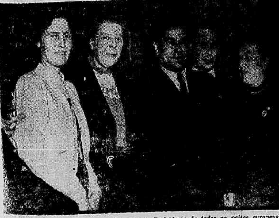
Reunindo personalidades e representantes da Resistência de todos os países europeus, arábica de encerrar-se em Viena o Encontro dos Antigos Combatentes da Resistência. Desto importante reunião é o flagrante acima, no qual se vê o herói soviético Alaric Meresliev ("Um Homem de Verdade") cercado de outros participantes do conclave. (Reportagem na terceira página).