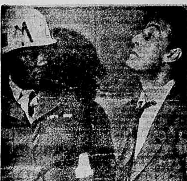
O popular comediante italiano, Totó, que aparece acima numa cena de "Napoleão Milionário", volta às telas cariocas em "O Homem da Calcinha", ao lado de Silvana Pampanini

"O Canto do Mar" trata do desejo universal. E o mar uma promessa de libertação da miséria. Sobre o pai e para seu filho, Raimundo, ele exerce uma atração quase sexual, é um ato final de repouso para o amor insatisfeito. Neste filme Cavalcanti mostra-se mais sutil e mais profundo do que no tratamento anterior dado por ele ao mesmo tema em "Enxada".