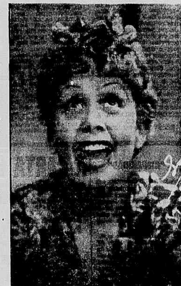
Dercy Gonçalves ocupará o Teatro Glória para uma tem- porada, o que é uma boa notícia.