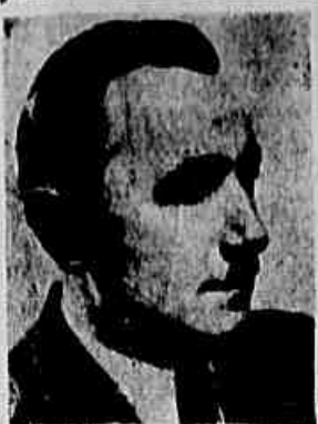
Dostev Blert, 1º secretário do Partido Operário Unificado Polonês