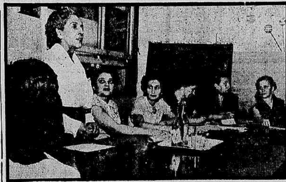
A mesa que dirigiu os trabalhos da assembleia feminina de ontem.

Durante a nossa permanência no Galeão, estivemos no PP-PDH que acabava de aterrissar depois de um voo de treinamento. Nessa ocasião, fomos informados que segunda-feira última estiveram naquele Aeroporto, diretores da empresa norte-americana, após o que se conseguiu a liberação do aparelho e o desembarco das mercadorias contrabandeadas.