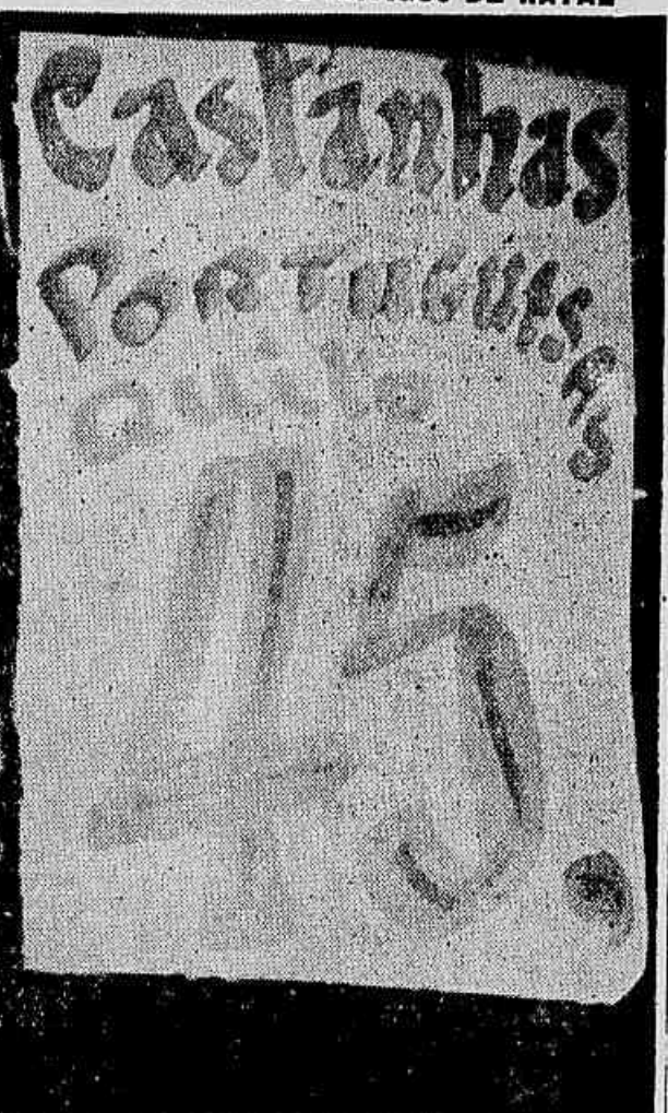
Este ano os artigos de Natal prometem chegar a preços proibitivos para a maioria da população carioca. O ano passado os preços já eram de amargar. A castanha, por exemplo, custou até 35 cruzeiros o quilo. Este ano, no entanto, já no início do período natalino, quando é mais barata, a castanha vai a 45 cruzeiros. Chegaram às nuvens nos últimos dias das festas do fim de ano.