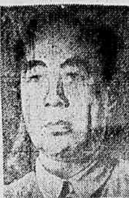
CHU EN LAI

É o seguinte o texto integral do comunicado, publicado simultaneamente na sede da ONU e em Pequim: O COMUNICADO "Em face da sugestão a favor de discussões privadas, feita pelo secretário-geral CONCLUI NA 2.ª PAG."