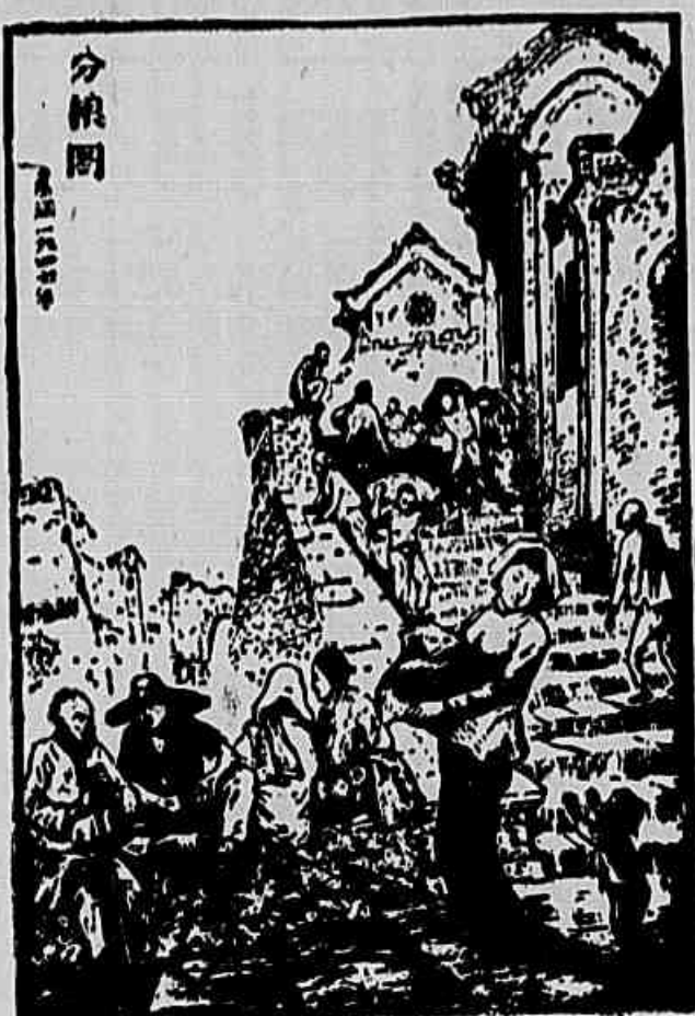
Gravura do artista chinês Ien Han