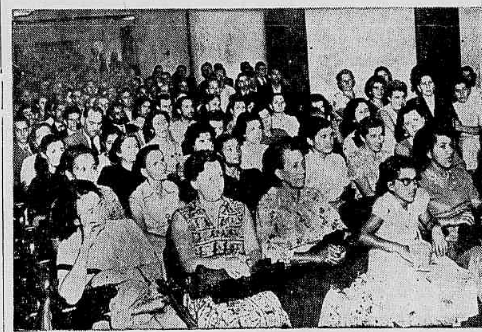
Aspecto parcial da grande assembleia do povo paulista contra a carestia

grande número de bairros da Capital, Associação Feminina de Santo André e várias outras de municípios vizinhos, Centros Espiritistas da cidade, de Guarulhos, de Santos e de João Cunha, Sindicato do Comércio Atacadista e Sindicato do Comércio de Gêneros Alimentícios, Associação dos Cooperativistas, S.A. Vila Unidos, e dezenas de outras organizações populares e associações femininas.