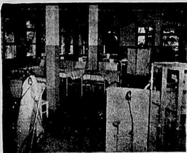
Visita da Enfermeira de Mulheres da 1.ª Clínica Cirúrgica do Hospital Pedro Ernesto. O Hospital tem capacidade para mais de mil doentes, mas somente cerca de 100 leitos estão sendo utilizados. Economia às custas da saúde do povo

A médica foi obrigada a amarrar o umbigo da criança com um barbante — Falta até esparadrapo e gase no Hospital dos Servidores — Enquanto isso, mil leitos vazios no Pedro Ernesto —