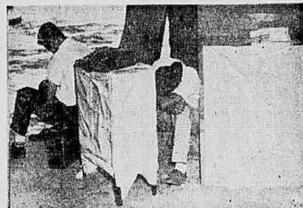
E' preciso ter muita paciência para suportar a longa demora de um «taiboba». A decisão da Light de retirá-los progressivamente do tráfego provocou um protesto da Liga do Comércio