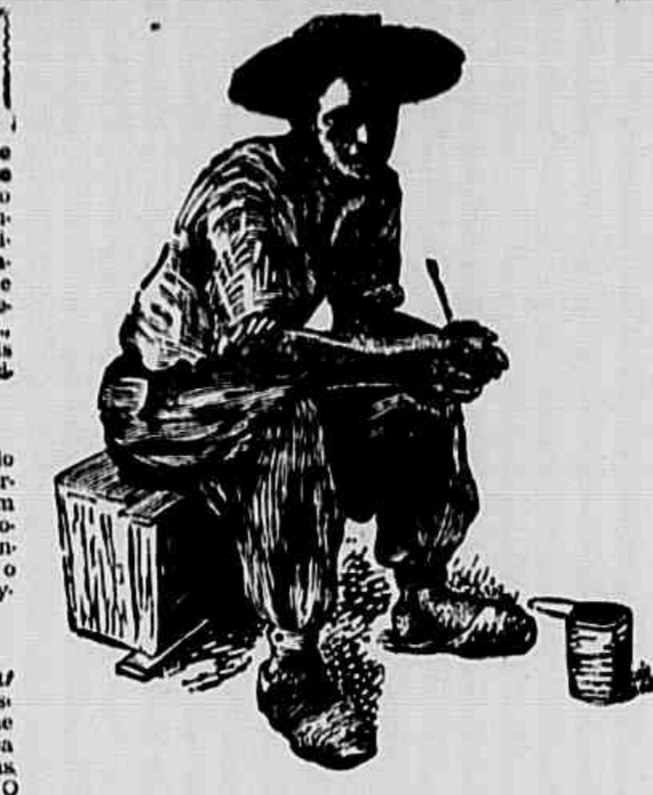
GAUCHO — Gravura de Glauco Rodrigues, do Clube de Gravuras do Porto Alegre