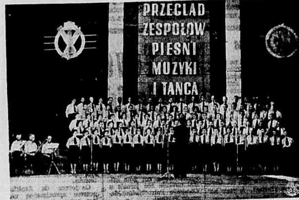
Na República Popular da Polónia grande carinho e atencioso cuidado são dispensados aos conjuntos de amadores. Estes existem em quase todas as empresas do país. Seu número atinge a mais de 20.000. No clichê vemos o conjunto de canto e danças do Sindicato dos Trabalhadores no Comércio