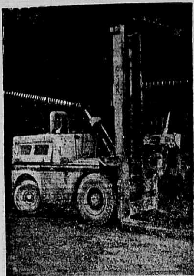
Uma das máquinas, ainda nova, encostada no Departamento de Obras há muitos meses, por falta de pequenas peças